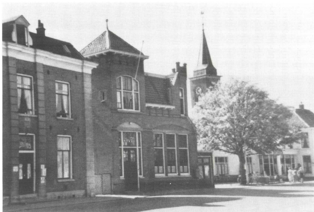
Afb. 1. De Tekenschool die aan de Straatweg stond, omstreeks 1910, op de plaats waar nu de RABO-bank aan de winkel van Lodder grenst.

naar Nederland en is hier gebleven, om zich te onttrekken aan verdere dienst in het Belgische leger. Zijn naam staat echter niet bij de 91 vluchtelingen te Breukelen in de "Opgave van vluchtelingen per gemeente in de provincie Utrecht", want hij werd eerst opgevangen in een andere gemeente. Op 24 september 1914 kwamen in Breukelen vier vluchtelingen aan en op 11 oktober nog 87. In Ruwiel kwamen er 30. Ze vertrokken tussen 15 en 28 oktober, voor het merendeel terug naar België.