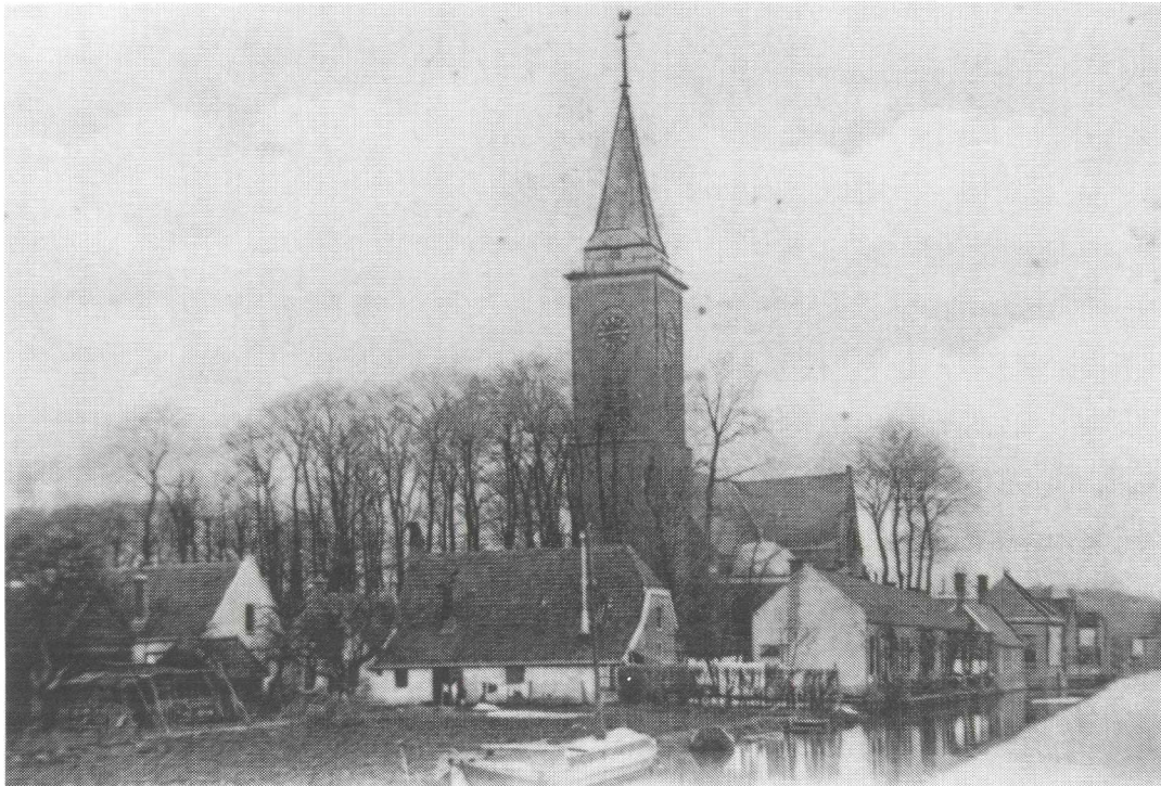
Afb. 2. De diaconiehuizen achter de kerk van Breukelen, omstreeks 1910.

dingstukken en lakens. Die werden aan de waslijn of bij de oven gedroogd. Soms werden ze naar de bleek achter de kerk bij vrouw Menke gebracht, die er geld voor kreeg. Een paar uur later moest je er weer heen om het wasgoed te keren en te begieten. Als de was niet naar de bleek ging, werd hij met chloor behandeld en met blauwsel gespoeld. Mevrouw Leyte stond iedere dinsdag te strijken: een heel karwei, vooral door het gesteven goed (bakkersjasjes, schorten en overhemden). Er lag ook een berg verstelgoed voor Sijtje Spee, de naaister. Die kwam al heel vroeg en bleef tot 's avonds zeven uur. Ze was heel handig en kon op zo'n dag net een jurk maken. Ze verdiende dan f 2 plus de kost. Mevrouw Leyte kreeg voor haar werk in huishouding en bakkerswinkel f 1 in de week en moest die in een spaardoosje doen. Vader Prins kwam wel eens controleren of ze er iets van had opgemaakt.