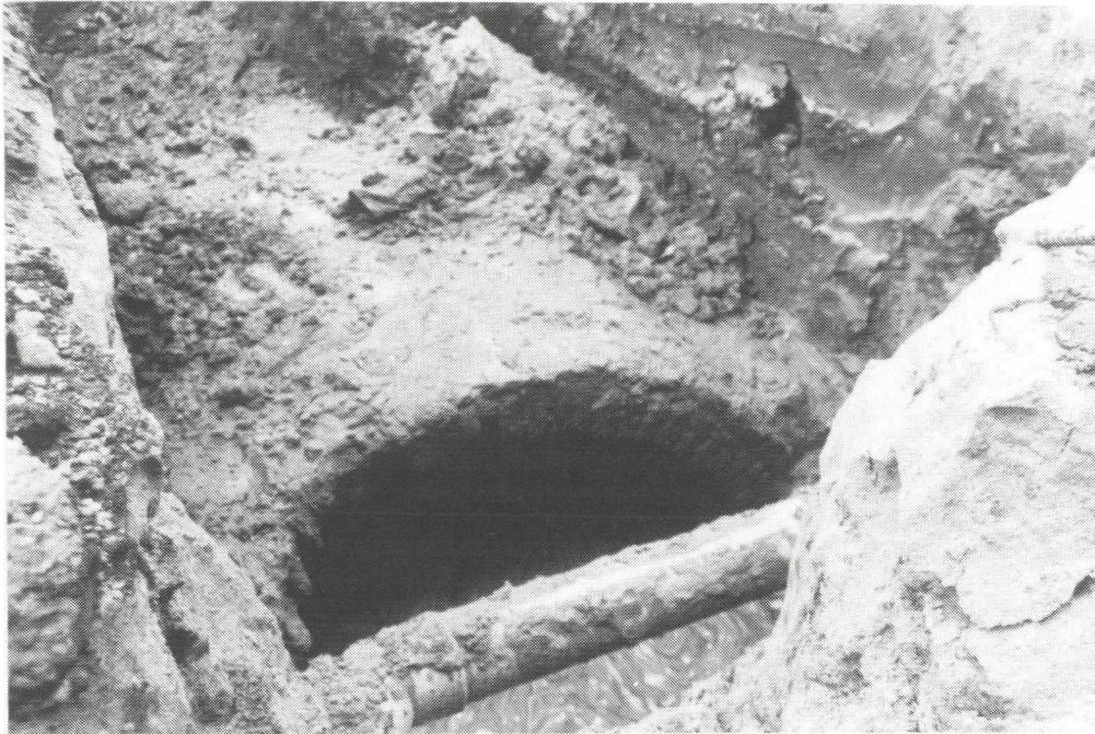
Afb. 4. De in 1994 opgegraven waterkelder van Boom en Bosch.

souterrain onder de koepelkamer was, stond een "onwijs groot fornuis" van wel vier meter lang. Als de mensen van Takke dat kwamen schoonmaken en poetsen, waren ze wel een dag bezig. De oude smidsknecht Blommenstein uit de Dannestraat (nu Foto De Graaf) deed dat altijd.