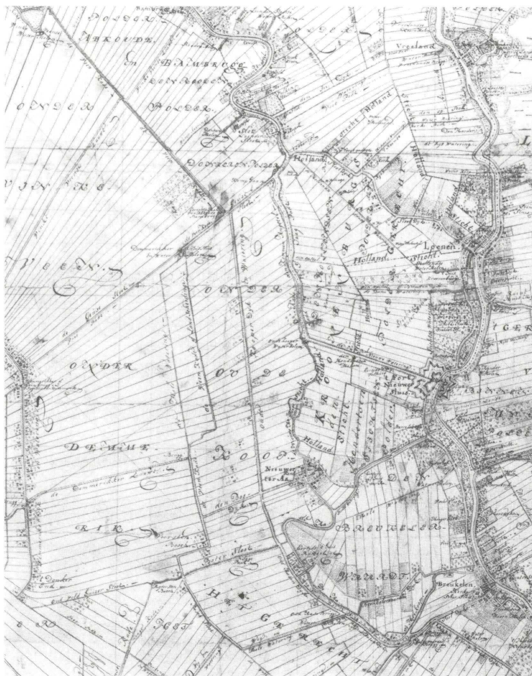
Afb. 3. Oukoop en omgeving. 9 Deze kaart geeft waterstaatkundige en bestuurlijke informatie. De Oukoper molen is weergegeven. Het patroon van de sloten is sterk vereenvoudigd, maar correct voor wat betreft de richting. Tussen Angstel en Vecht zijn de toenmalige grenzen tussen Holland en het Sticht zichtbaar.