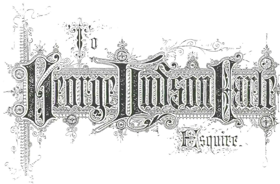
Afb. 1. Gekalligrafeerde tekst op het titelblad van het album.