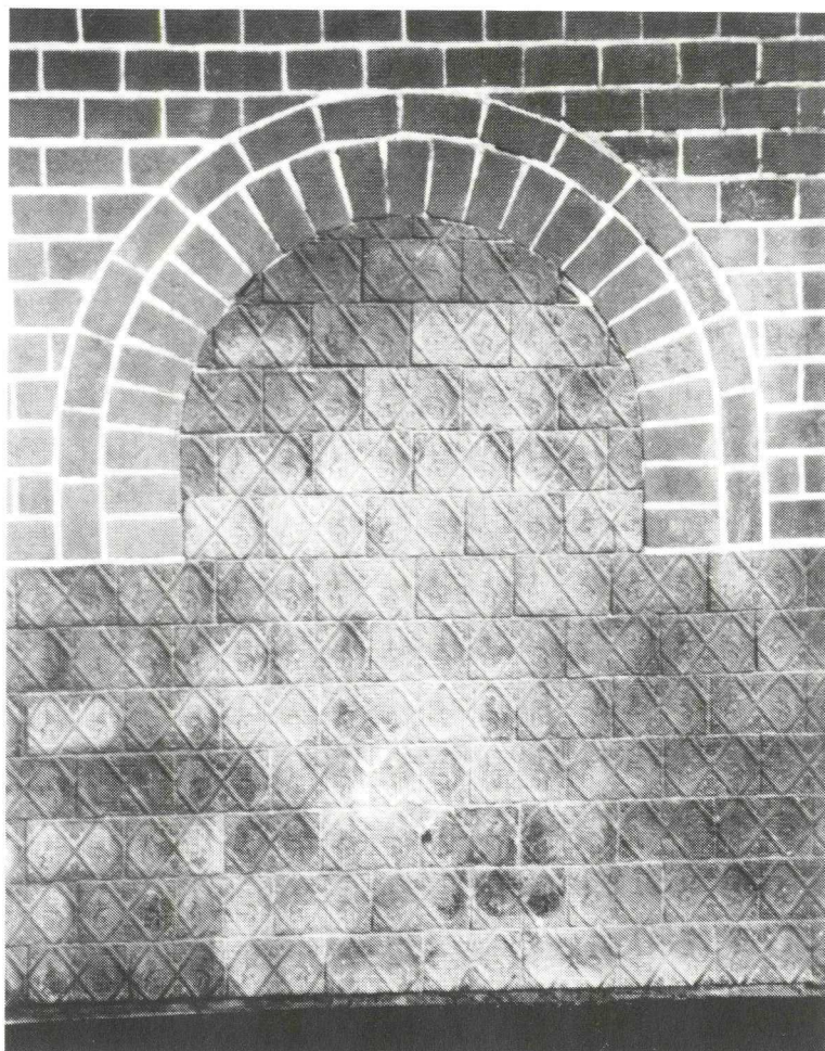
Afb. 1. Haardstenen uit 1598, ingemetseld in de achterwand van de consistorie van de Pieterskerk te Breukelen.

De stenen zijn voorzien van opstaande geprofileerde randen, die ruitvormige vlakken begrenzen. Door de stenen in verspringend verband te stapelen, dat wil zeggen dat de verticale voegen niet boven elkaar staan, liepen de randen in elkaar door en ontstond een samenhangend patroon. Men noemt dat dan rapportstenen.