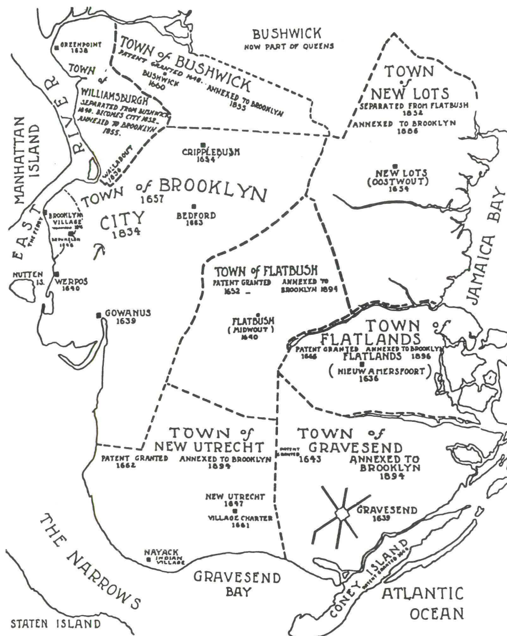
Afb. 1. Kaart met de grenzen van de oorspronkelijke Nederlandse en Engelse plaatsen die gezamenlijk het huidige Brooklyn vormen. (Uit: E. Nooter, 1984. The Old Dutch Homesteads of Brooklyn . The Long Island Historical Society, Fig. 1.)

land, Brucklyn en Broucklyn. Langzaam verengelste dit tot Brookland of Brookline, waarna aan het eind van de 18de eeuw de standaardspelling Brooklyn werd.