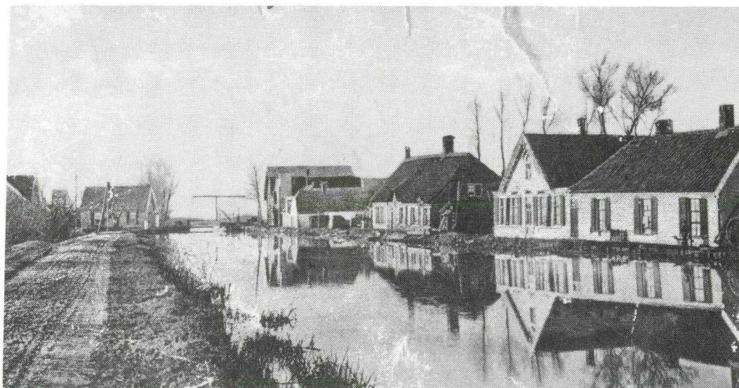
Afb. 5. Nabij de Portengense Brug omstreeks 1900. In het midden aan de overkant van het water, direct voorbij de grote boerderij rechts op de voorgrond, een blok met drie eenvoudige huizen onder één kap, rietgedekt, die eigendom waren van de Armmeesters van Ruwiel. (Oude prentbriefkaart.)