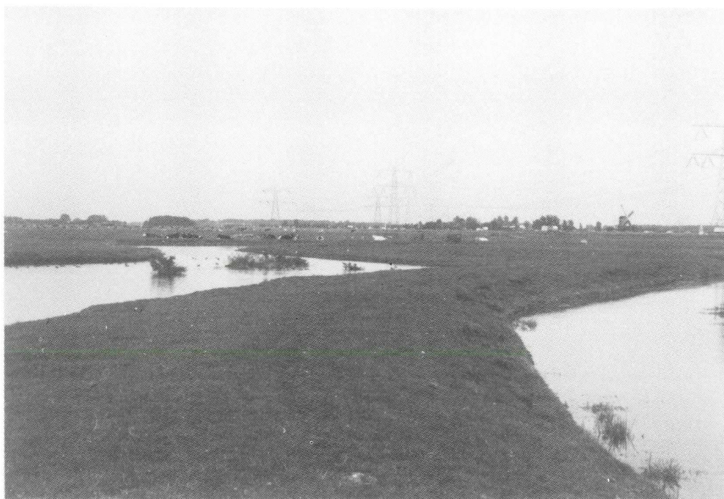
Afb. 2. Het landschap bij het Papenestje. Links de Kromme Angstel. In het midden een graskade. Ten oosten daarvan een gegraven halfcirkelvormige watergang.

Het Huis Het Honderd staat niet op de van kracht zijnde Monumentenlijst, misschien omdat er buiten zowel als binnen nogal veel aan het pand veranderd is (boven de hoge oude kelder zijn in deze eeuw bijvoorbeeld drie slaapkamers getimmerd). Niettemin zouden bij sloop of verval veel historisch interessante details verloren gaan. Bij de in 1992 uitgevoerde inspectie in het kader van het Monumenten Inventarisatie Projekt zijn zowel de boerderij als het er achter staande 18de-eeuwse zomerhuis (Honderdsche Laantje 4a) wel als historisch waardevol aangemerkt. Onduidelijk is nog wat dat op het punt van bescherming tot gevolg zal hebben. Een beslissing daaromtrent door de Rijksoverheid is op z'n vroegst in 1998 te verwachten.