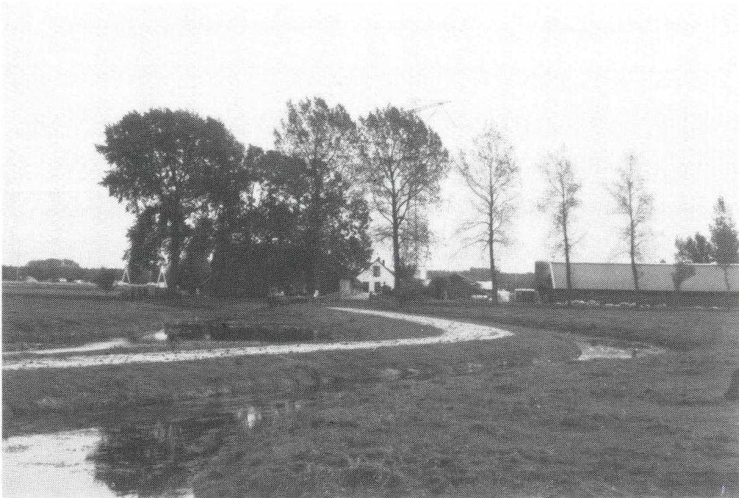
Afb. 5. Het noordelijkste gedeelte van de in Afb. 1 getoonde graskade is verhard en loopt naar de boerderij Het Honderd toe. Links van de kade nog steeds de meanderende Kromme Angstel en rechts een gegraven waterloop.

bouw heeft gestaan. Minder gemakkelijk is uit te sluiten dat er in een zeer ver verleden ooit een houten woontoren stond, van het type als het oudste Huis Ruwiel, 4 maar de huidige verdeling van land en water biedt ook voor een dergelijke gedachte geen concrete aanknopingspunten.