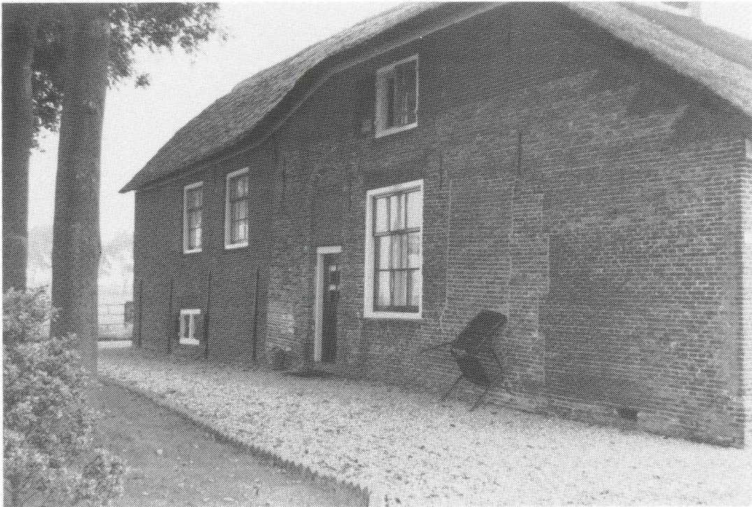
Afb. 3. Voorgevel van het voorhuis van de krukhuisboerderij Het Honderd. Duidelijk is te zien, dat enkele keren veranderingen in die gevel zijn aangebracht. Boven de deur is zichtbaar, dat zich daar vroeger een grotere boogdeur heeft bevonden.

Voor de opmerkelijke landschappelijke constellatie binnen wat zij het Papenestje noemen geven zij de verklaring, dat de eertijds onverharde weg voorheen ook daar langs het riviertje liep, over de genoemde graskade. De huidige bocht in de weg, naar het oosten, zou van betrekkelijk recente datum zijn. Inderdaad volgt de oude graskade helemaal de rivierloop, totdat zij via een recentelijk verhard gedeelte ongeveer tegenover de boerderij op de huidige weg uitloopt (zie Afbeelding 5).