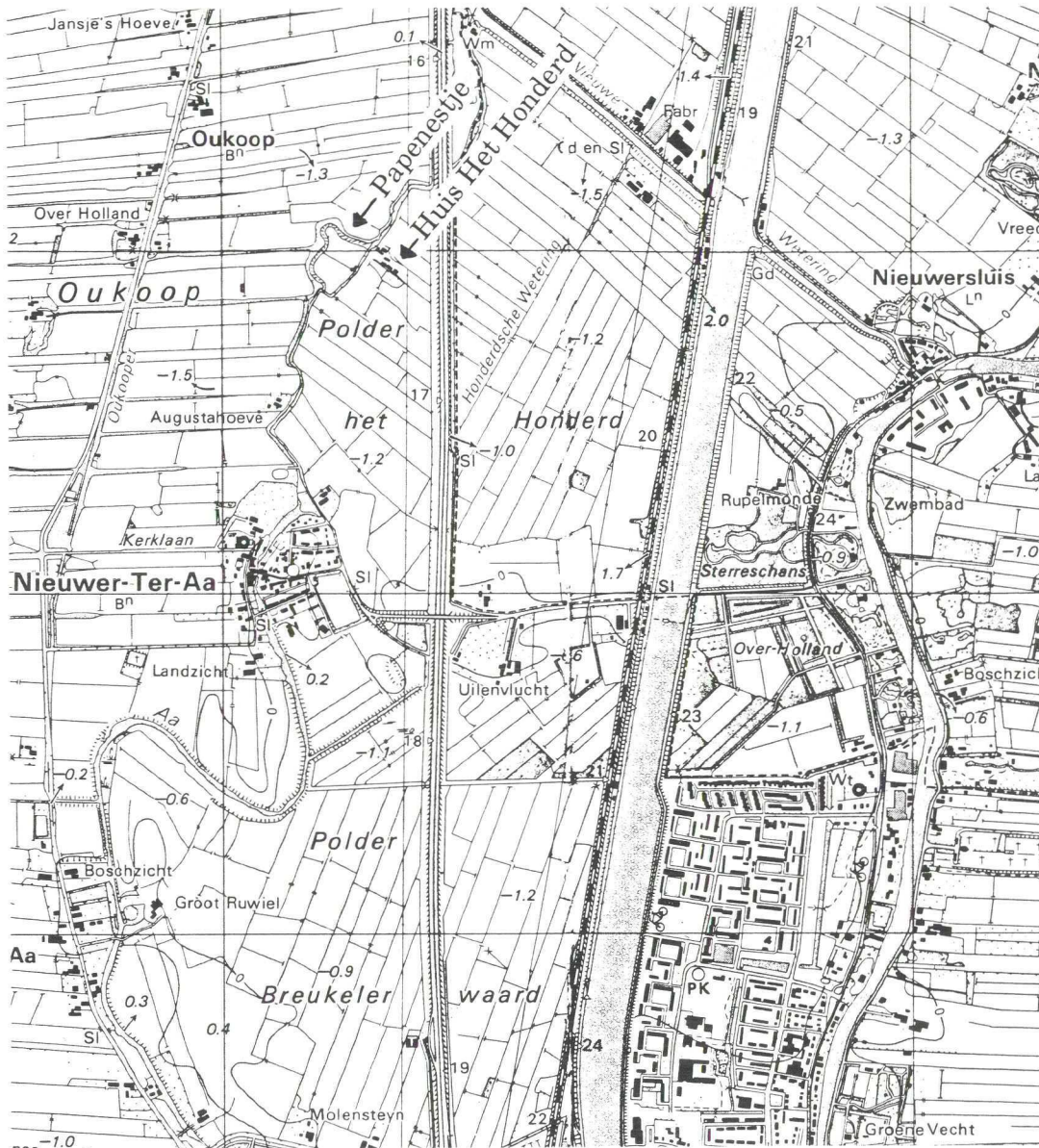
Afb. 1. Gedeelte uit de Topografische Kaart van Nederland, blad 31E - Vinkeveen, uitgave 1981, met daarop aangegeven de positie van het Papenestje en de boerderij Het Honderd.

zeer oude voorgevel zichtbaar zijn, waaronder een dichtgemetselde boogdeur, zouden daar nog op wijzen (zie Afbeelding 3).