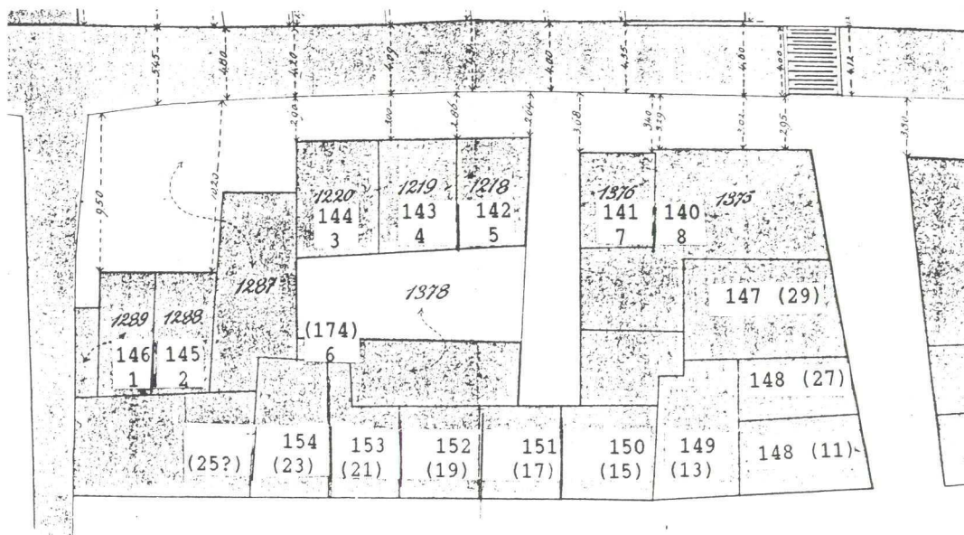
Afb. 3. Fragment van de situatietekening in verband met de verbetering van de Danne met kadasternummers en maten uit 1888 (zie Tijdschrift Historische Kring Breukelen, jaargang 3, nr. 3, 1988, blz. 100 - 101). De huisnummers uit 1885 en 1950 zijn door mij toegevoegd.