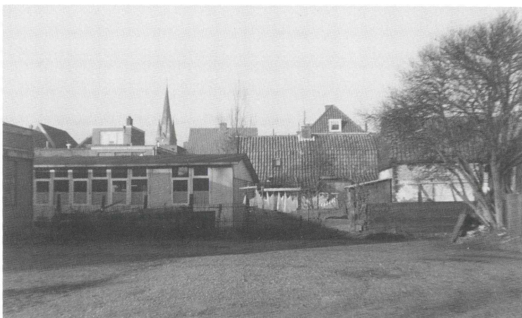
Afb. 5. Het houten arbeidsbureau omstreeks 1964. Op de achtergrond staan de huizen Dannegracht 3 - 5, op de voorgrond ligt het terrein van Van Stam met de erfscheiding bij de Koeckenbuurt, waarvan rechts nog een restant.

De huizen aan de Dannegracht waren, als zovele in het dorp, eenkamerwoningen met een trapportaal en een zolder. Tegen de achterwand van de kamer bevonden zich twee bedsteden met een kast ertussen. In de kamer stond vaak een fornuis, maar een kooktoestel werd ook wel in het portaal onder de trap gezet, waar na de aanleg van het drinkwaterleidingnet in 1928 ook de waterkraan werd gemonteerd. Een toiletruimte was er niet, want de zeven huizen achter Het Keyserrijk hadden twee gemeenschappelijke buitentoiletten, één in de steeg tegenover Cazant en één om de hoek op de binnenplaats tegen de achtermuur van het huis Dannegracht 5. Jan Boekweit maakte daar geen gebruik van, want hij had stiekum een toilet gemaakt in zijn schuurtje, dat op de sloot naast zijn huis loosde. 29 Deze in 1767 verbrede sloot, ook wel "de wijk" genoemd, liep achter garage Van Ekris, waar toen nog een helling met een rails en een lorrie was, om schepen op de wal te trekken en scheepsmotoren te repareren.