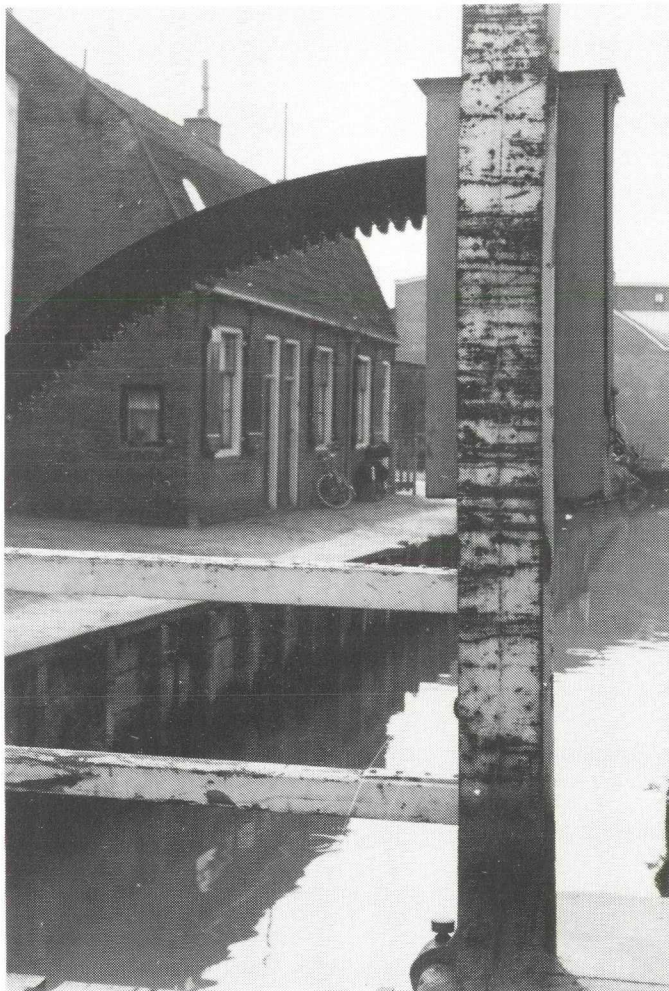
Afb. 4. De huizen Dannegracht 5, 4 en 3 gezien vanaf de Dannebrug in 1964.

geven over de voortgang van de onbewoonbaarverklaring van slechte woningen, waarop Volkshuisvesting had geadviseerd een saneringsplan voor "de oude binnenstad" op te laten stellen. 24 De raad was hiermee akkoord gegaan en de stedenbouwkundige, ir E.J. de Maar, kreeg daartoe opdracht. Op het terrein tussen Markt en Danne werden rijksgebouwen geprojecteerd voor een Gewestelijk Arbeidsbureau, een Centraal Belastingkantoor en een Postkantoor. Omdat vele van de daar staande huizen niet voldeden aan de eisen van de bouwverordening, ging de Gemeenteraad op 7 juni 1955 akkoord met een voorlopige saneringsschets en op 3 april 1956 met de voorgestelde rooilijnen en bouwverboden. 24 De slechtste huizen in de Dannestraat waren toen al lang onbewoonbaar verklaard.