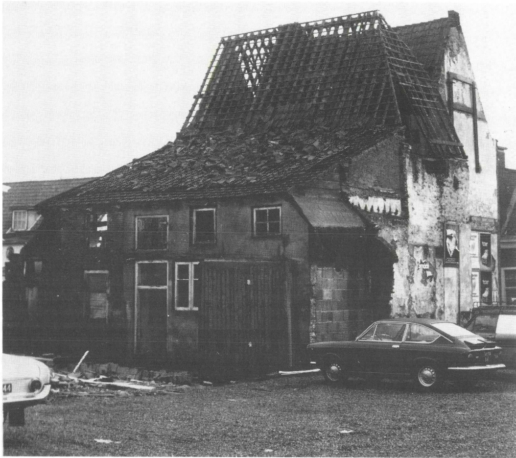
Afb. 8. Het laatste stukje van Het Keyserrijk in februari 1971, gezien vanuit het zuidwesten.

De verkoop in 1964 was een ruilvereenkomst met bijbetaling door de Gemeente Breukelen, die het winkelpand Herenstraat 4 beschikbaar stelde.