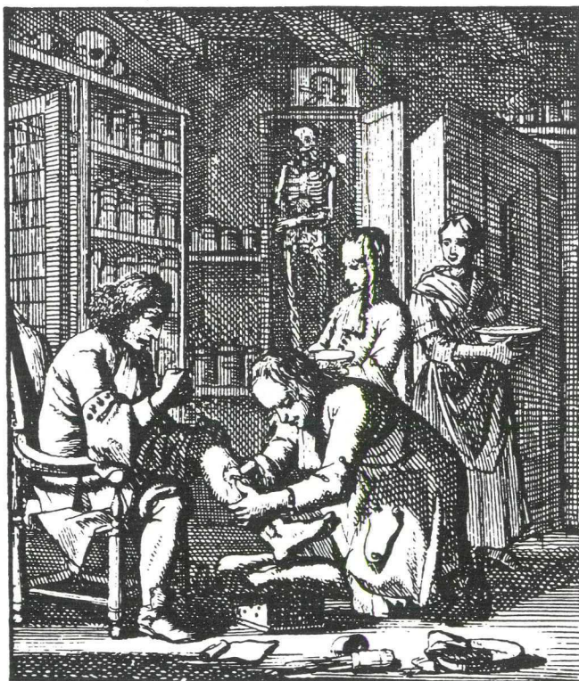
Afb. 2. De chirurgijn. (Uit: Jan Luyken, 1694. Het Menselyk Bedryf.)