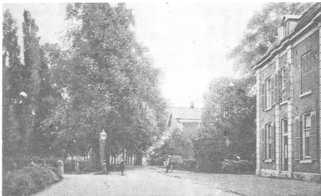
Afb. 2. De Straatweg omstreeks het begin van de 20ste eeuw, met naar links daarvan aftak- kend de nieuwe weg naar Boom en Bosch met daarachter de boomgaard die in 1926 markt- plein zal worden. (Oude prentbriefkaart.)

Bij Het Keyserrijck lag dus een mestvaalt, die gediend zal hebben om het huisvuil en de mest uit de stal op te slaan. Ten zuiden van dit noordelijke gedeelte van het erf was een greppel, die het regen- en afvalwater in westelijke richting naar de scheisloot zal hebben afgevoerd.