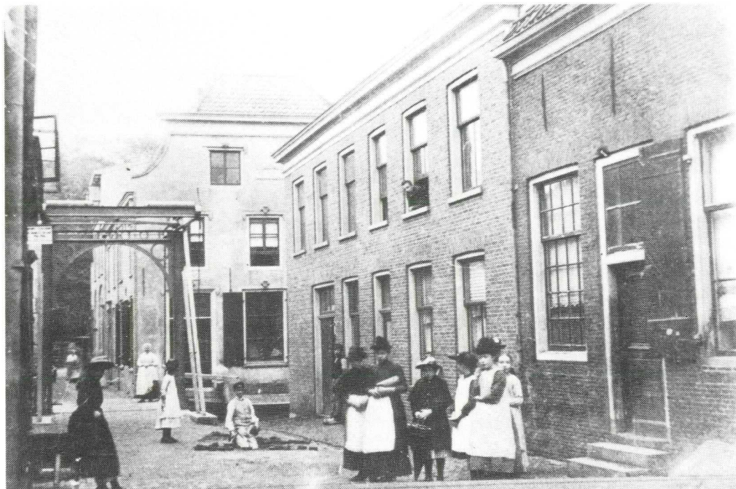
Afb. 3. Dannestraat met Het Huys te Keyserrijk omstreeks 1900. (Oude prentbriefkaart.)