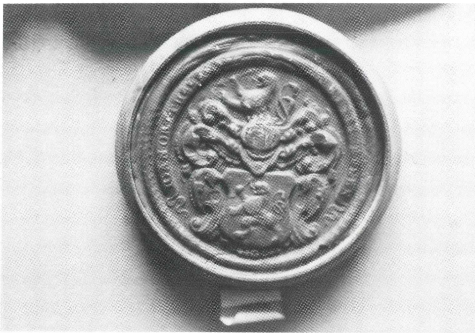
Afb. 2. Zegel van de leenakte uit 1796, inzake de grond behorende bij het pand aan de Achterstraat.