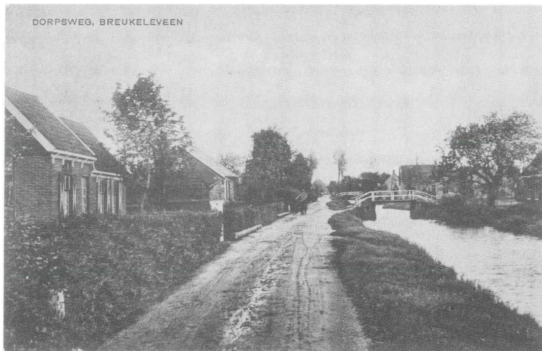
Afb. 1. Breukeleveen, ter hoogte van de huizen thans genummerd Herenweg 113 (links) en 115 (waarin eerder het ziekenhuis van Breukeleveen was ondergebracht). De foto dateert uit 1921, want langs de weg liggen de lange palen gereed voor de aanleg van het bovengrondse elektriciteitsnet.

Aan een benoeming tot gemeentegeneesheer zaten zekere beperkingen van de bewegingsvrijheid vast. "Hij zal, langer dan 24 uren de Gemeente verlatende, daarvan aan den Burgemeester van Tienhoven schriftelijk kennis moeten geven; zonder diens verlof zal hij zich niet langer dan drie dagen van zijne standplaats mogen verwijderen. Hij zal bij elke afwezigheid in de behoorlijke waarneming voorzien, waarvan de kosten voor zijne rekening zijn". De gemeentegeneesheer was tevens verplicht gedurende de hele periode waarvoor hij door alle drie gemeenteraden was benoemd en hij die betrekking ook daadwerkelijk uitoefende, in het voor hem bestemde huis te Tienhoven te wonen. 2