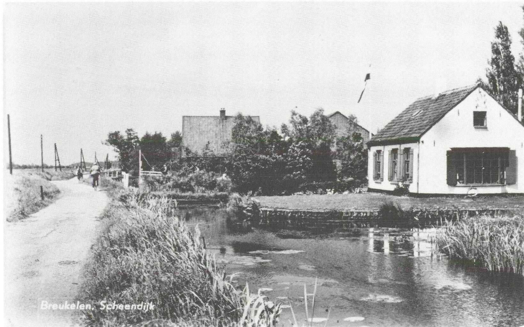
Afb. 2. Oude prentbriefkaart uit de jaren 1950 (Collectie Fam. Heus). Het huis van de familie Wiegmans, op de achtergrond, was net gebouwd; het witte huis werd bewoond door de familie Hensbergen (thans Scheendijk 5).