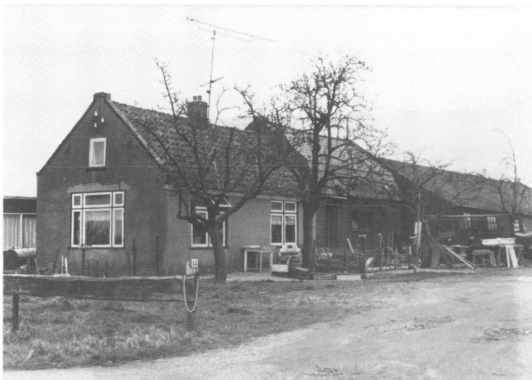
Afb. 5. Het huis van mijn opa Gert Heus, Scheendijk 23, eind jaren 1970. Het huis is verbouwd, de botenloods rechts is er bij gebouwd. Rond 1980 is het huis afgebroken; thans staat er jachthaven De Evenaar.