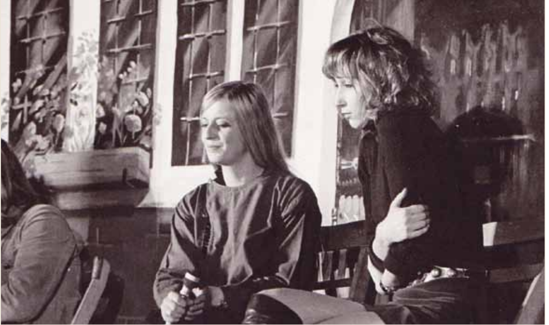
Acteurs voor het decor In den Grooten Slock voor 'Oh, Johnny Hus', gemaakt door Max Keuris. – 19 november 1971.