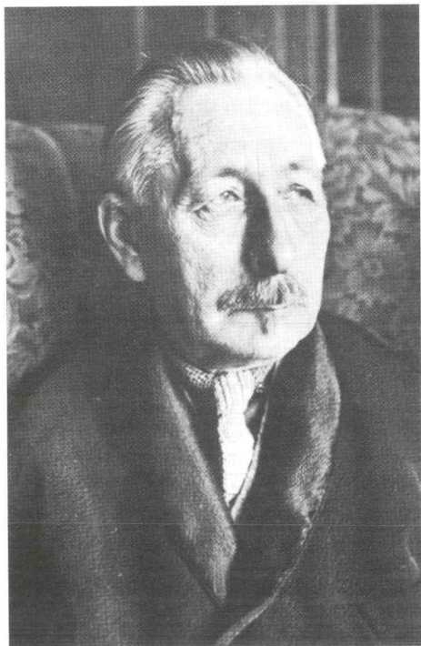
Pieter Jelles Troelstra, voorman van de SDAP.

Aan het einde van de eeuw was het niet langer vanzelfsprekend dat arbeiders hun lot gelaten droegen. Vooruitstrevende burgers hadden sedert de jaren zestig 'self-help' gepropageerd. Zij wilden dat de werklieden op eigen benen konden staan. Behalve door een goede opleiding kon dat ook worden bereikt als de werklieden