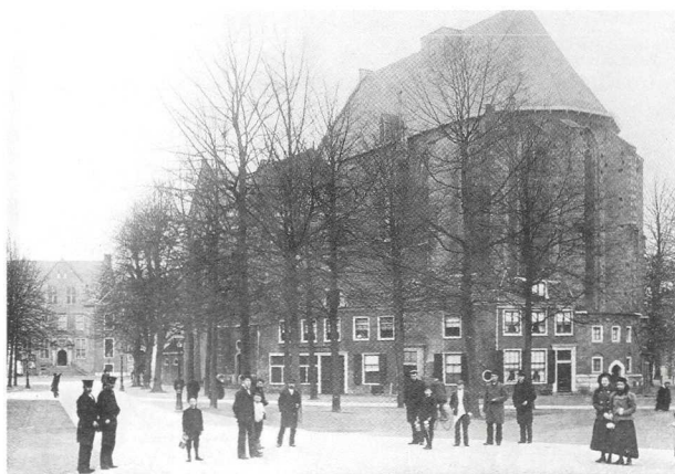
Het Janskerkhof plm. 1900. GAU, TA Janskerkhof ca. 1900 (10) door G. Jochman, neg. C 17.015.

het vakantie seizoen. 'De heeren [raadsleden, 'tH] zijn geen kwâ-jongens, het zijn meest professoren en doktoren, die niet voor iedere kleinigheid bijeen kunnen komen.' De zaak kon trouwens best een paar dagen wachten tot de volgende vergadering. Wel beloofde de burgemeester dat hij zou laten onderzoeken of de ge-