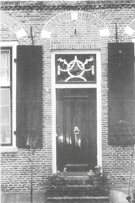
Foto 5: De grote voordeur hoort echt bij het karakter van het pand, maar wordt niet meer als normale ingang gebruikt, zoals bij de meeste boerderijen. Vergelijking met foto nr 6 (van omstreeks 1910) toont aan, dat de versiering in het raam boven de voordeur van latere datum is. Vroeger was het een "levensboom". Ook zijn de stoep treden sedertdien vernieuwd en de muur is nu zonder pleisterwerk.