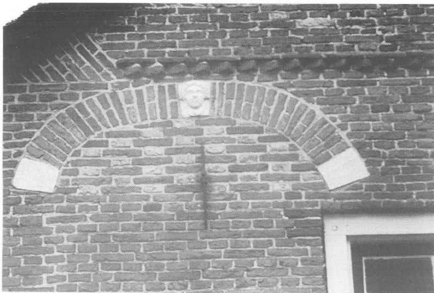
Foto 7: Opname van één van de acht stenen kopjes, als versiering van de ronde bogen boven de ramen in de voorgevel.

Uit de lijst blijkt, dat de boerderij telkens langer dan één generatie eigendom was van een bepaalde familie. Ook zie je, dat de boerderij verkocht werd aan een andere familie als er geen nakomeling was die de bedrijfsvoering kon overnemen. De familie Bieshaar is tot nu toe het langste eigenaar geweest (1817 tot 1919), maar deze lange periode betrof slechts twee generaties. Familie Van Klooster woont er nu al met de derde