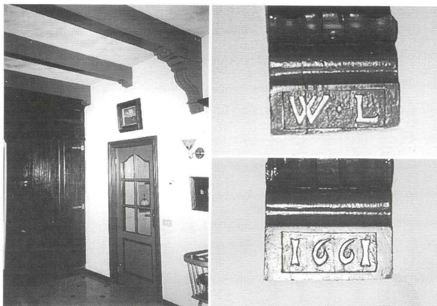
Foto 2: In de noord-westhoek van de grote voorkamer staat de eikenhouten ombouw met ribprofiel, waarachter vroeger de trap en nu een kast. De bint toont aan de uiteinden het jaar van de bouw 1661 en de initialen van de opdrachtgever WL, waarvan een close-up hierbij is afgedrukt.