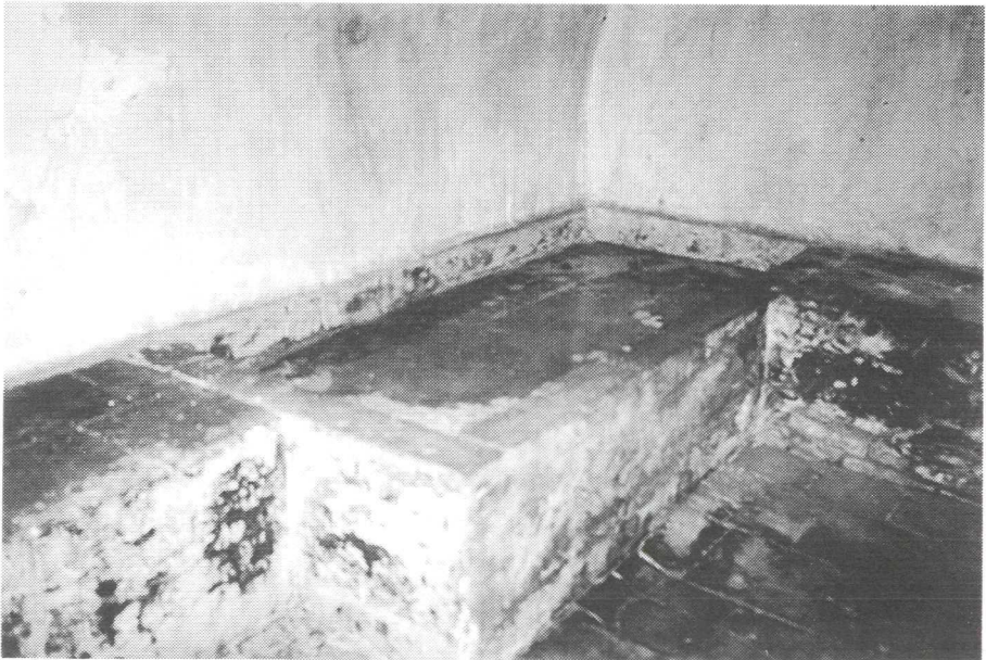
Foto 4: De kelder heeft nog de originele pekelbak, waarin vroeger het vlees werd geconserveerd. Het is een gemetselde stenen bak van 160 x 65 cm met een diepte van 10 cm; ongeveer 40 cm boven de vloer van rode plavuizen.