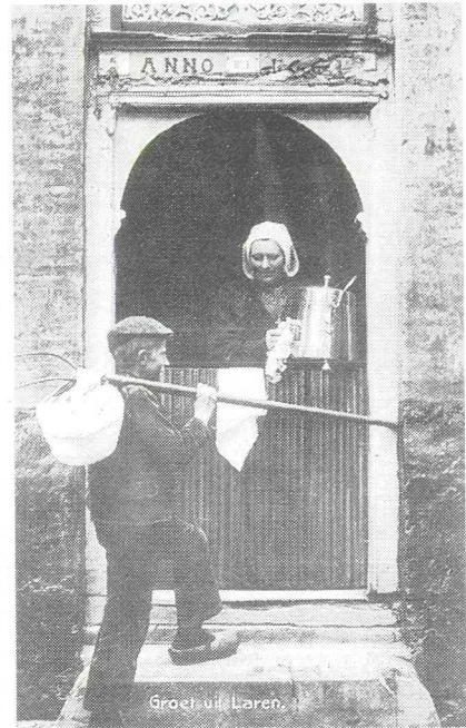
Groet uit Laren.