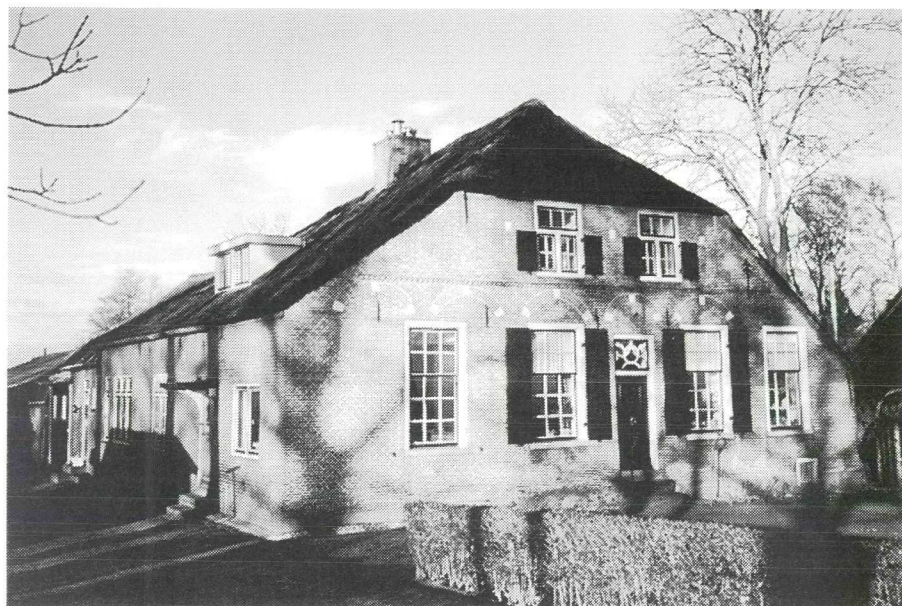
De voorgevel is bijzonder. Deze heeft niet het stoere rechtlijnige uiterlijk, dat het kenmerk is van veel boerderijen in Eemnes, maar het is een gevel met meer versiering. Het Monumenten Inventarisatie Project van provincie Utrecht schreef in het in 1992 uitgegeven rapport: stijl renaissance, manierisme. Bij de laatste verbouwing is de dakkapel geplaatst en is de schoorsteen gewijzigd.