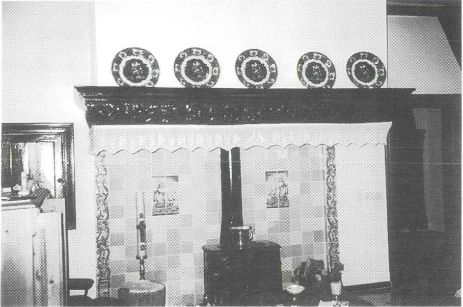
Foto 3: De omlijsting van de schouw heeft een in "kwabstijl" bewerkte balk. In de kamer staat een oude kussenkast met dezelfde figuren in het hout. De tegels zijn nieuw aangebracht.

koeien stonden. Het vee staat sedert 1991 in een los gebouwde ligboxenstal, ver achter de boerderij. Door de strengere milieuwetgeving werd de nieuwe stal noodzakelijk, maar het heeft ook geleid tot een betere moderne bedrijfsvoering. De vroeger gebruikelijke kleine stalraampjes zijn al jaren geleden vervangen door grotere ramen, om meer licht in de stal te krijgen. Dat werd toen geëist door de keuring voor het "melkpredikaat".