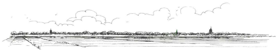
Zicht vanuit de Eemnesser polder op Eemnes Links Het Dikke Torentje, midden: R.K. kerk en rechts de Ned. Hervormde kerk aan de Kerkstraat.

Maar de vissen van de Eem beten niet en het begon te motregen. Na een poosje besloot ik om maar weer naar huis te gaan.