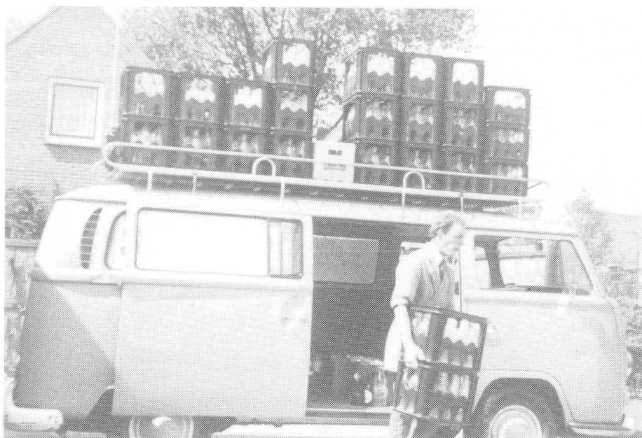
Felix Zwanikken druk in de weer met zijn melkbus, hier geparkeerd bij zijn huis op Laarderweg 45 (Foto ±1970)

bezittende een bedrijf handelend in melk en zuivel.