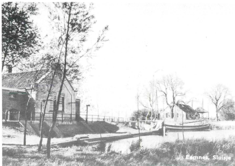
Zicht op Eemnesser Sluis vanaf de Eem. Links het Gemaal.

Het is de bedoeling dat het Sluisje weer volledig in ere hersteld zal worden. Dat betekent dat de situatie weer net zo zal worden als in 1650 toen de stenen Sluis gebouwd werd.