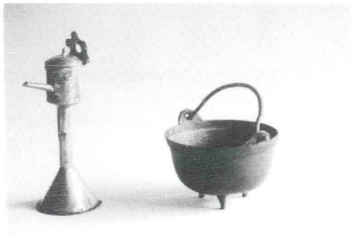
Snotneus en komfoor

Geheel rechts van de schouw in het veurhuus stond