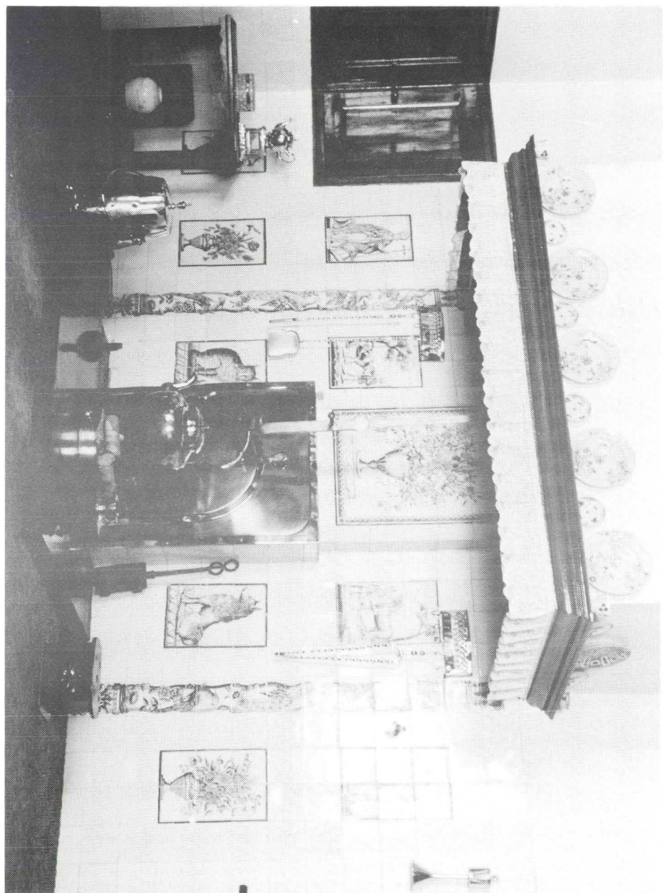
Veurhuus van Wakkerendijk 116