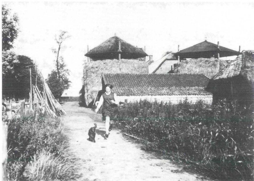
Achterzijde van de boerderij van de familie Van Stoutenburg Wakkerendijk 118.

In tegenstelling tot de kleipolder was dat de afgeveende grond waar de koeien afwisselend verkampt werden.