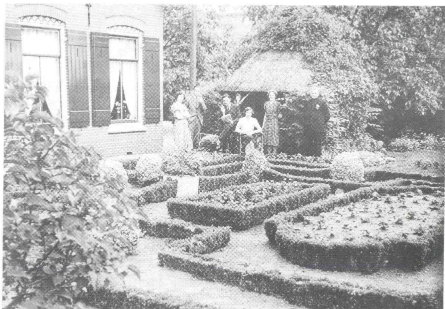
Familie Van Stoutenburg in de voortuin bij hun boerderij Wakkerendijk 118

Vaart, (daar is een zandbank). Achter onze boerderij had je de Driest waar op Tweede Paasdag het Paasvuur aangestoken werd. In de Paasvakantie (De Goede Week) werd daar alle mogelijke brandbare afval voor verzameld. Ik zie nog mijn vader voorop lopen en met een bos stro en omringd door ons allemaal ging dan die huizenhoge stapel in de fik. Dat gebeurde altijd tegen schemer als het donker werd.