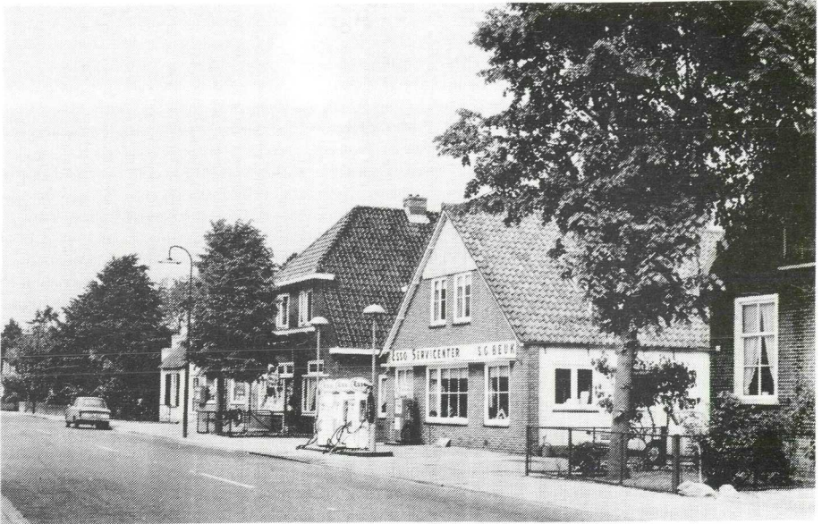
Beeld van de Wakkerendijk in de zestiger jaren. In het midden, links van garage Beuk de winkel van Raven. Uiterst rechts een deel van het afgebroken huis van Drikus de Gooijer.

In 1936 was het klaar en trouwden wij. Ik begon het kruidenierswinkeltje, maar moest het eerst helemaal opwerken, dus bleef mijn man timmeren bij Eggenkamp. Dat winkeltje was me wat in het begin. Grote zakken bonen, zout, suiker enz. werden naar boven gebracht, waarna je al die spullen weer in emmers naar beneden moest sjouwen om af te wegen en in zakken te doen. Vooral stroop afwegen als het koud was, was een heel karwei, want dan bleef zo'n klodder stroop steeds aan de lepel plakken. Want verwarming bestond natuurlijk nog niet.