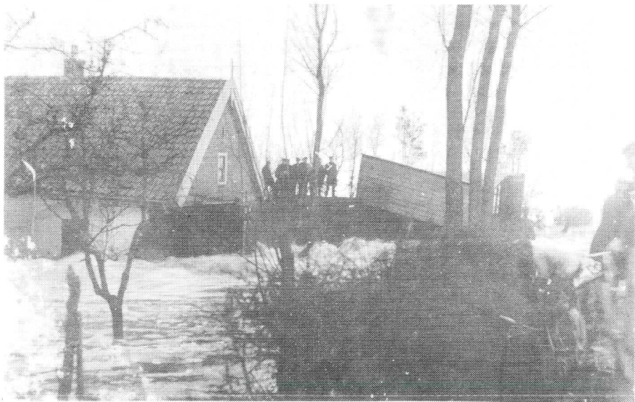
Het huis Meentweg 125, verwoest tijdens de overstroming van 1916

Hier woonde de familie Hagen van ± 1845 tot ± 1900