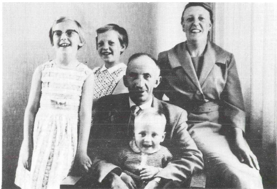
De familie Hagen rond 1960

Ze noemden hem wel eens de professor. Hij heeft met zijn