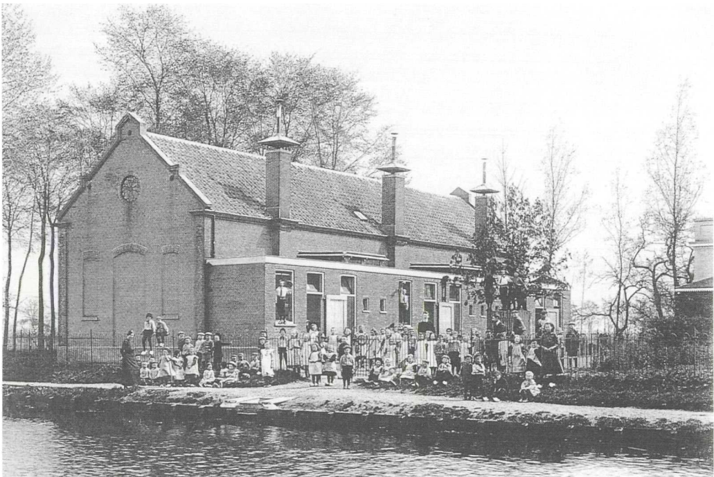
De openbare lagere school in 1914; foto uit het "Gedenkboek Paling", coll. Streekarchief Rijnstreek.

Ook leuk had moeten zijn het 25-jarig ambtsjubileum van schoolhoofd Van Wijngaarden. In de raadsvergadering van 4-3-1901, deelde de burgemeester dit aanstaande, heuglijke feit mee aan de gemeenteraad van Barwoutswaarder die het bericht, nauwelijks geïnteresseerd, als kennisgeving aannam. In een volgende vergadering kwam de burgemeester toch eens op dit onderwerp terug. Hij had vernomen dat het jubileum feestelijk zou worden herdacht en hij vroeg de gemeenteraad hoe zij stond tegenover het aanbieden van een cadeau namens de gemeente.