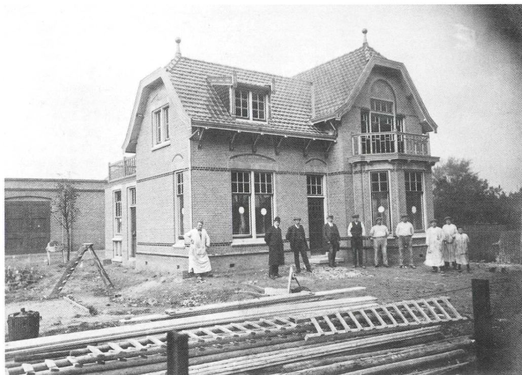
De gasmeesterswoning, kort na de oplevering.

tijd van 1 tot 18 jaar te onderhouden - doen de meerderheid van de raad niet milder stemmen. De burgemeester slaagt er niet in het gemeentebestuur op andere gedachten te brengen. De gasdirecteur heeft een zodanig salaris dat daar wel zo'n 10% op gekort kan worden, vindt een meerderheid. Dat de raadsleden zich grote moeilijkheden op de hals halen door een algemene loonmaatregel op slechts één persoon van toepassing te verklaren, gaat er bij hen niet in. Eerst zien, dan geloven. Met een koppig "neen" worden alle verzoeken om intrekken van het gewraakte raadsbesluit van de hogere overheid beantwoord: In januari 1934 verzoeken gedeputeerde staten om intrekking van het raadsbesluit. Tevergeefs. In mei volgde bij Koninklijk Besluit een aanmaning. Ook dit legt de raad met 4 tegen 3 stemmen naast zich neer. Tot slot volgt er op 9 juli een nieuw Koninklijk Besluit, waarin burgemeester en wethouders worden uitgenodigd het raadsbesluit in te trekken. En aldus geschiedt. Het college was toch altijd al een tegenstander geweest van deze move van de gemeenteraad. 7