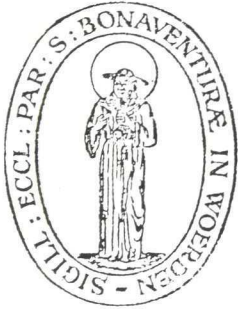
Het kerkzegel van de Rooms-Katholieke parochie van Woerden.