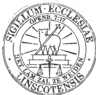
De kerkzegels van de Nederlandse Hervormde gemeente van Bodegraven (links en midden) en Linschoten (rechts).