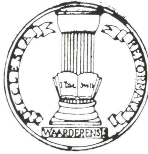
De kerkzegels van de Gereformeerde kerken van Reeuwijk en Waarder.