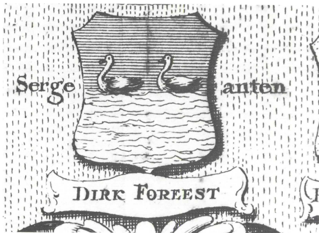
Fragment van een kaart van de Amsterdamse wijken, no. 60, 1749.