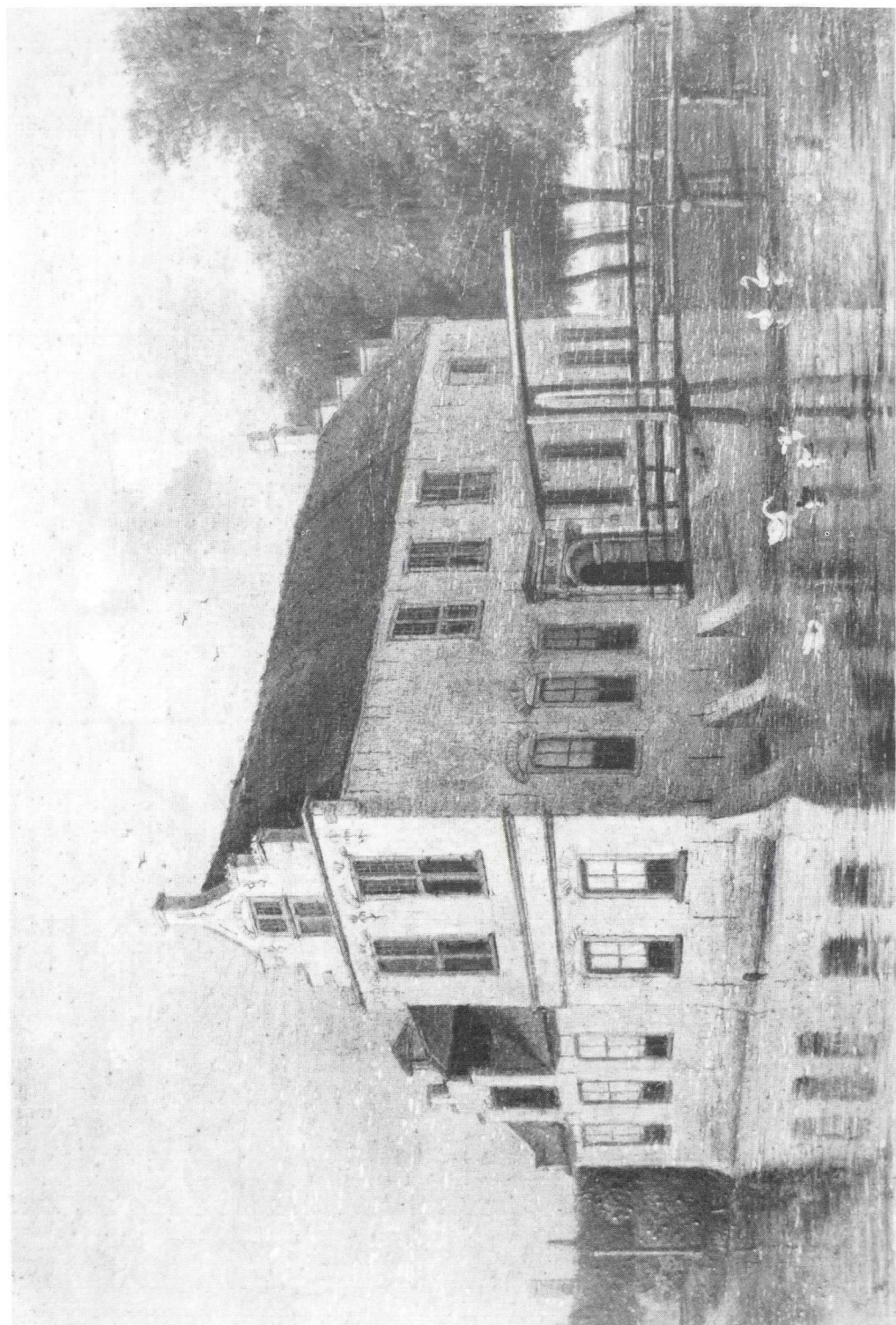
Batestein, gezien vanuit het noordwesten, 2e kwart 19e eeuw, naar de gravure van H. Spilman. Anoniem, olieverfpaneel, 250x390 mm. Particuliere collectie.