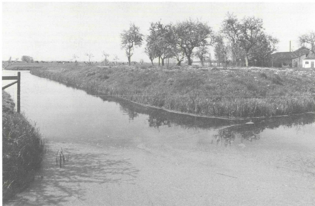
Afb. 4. Gezicht over het kasteelperceel (nu boomgaard) vanuit het noordoosten.