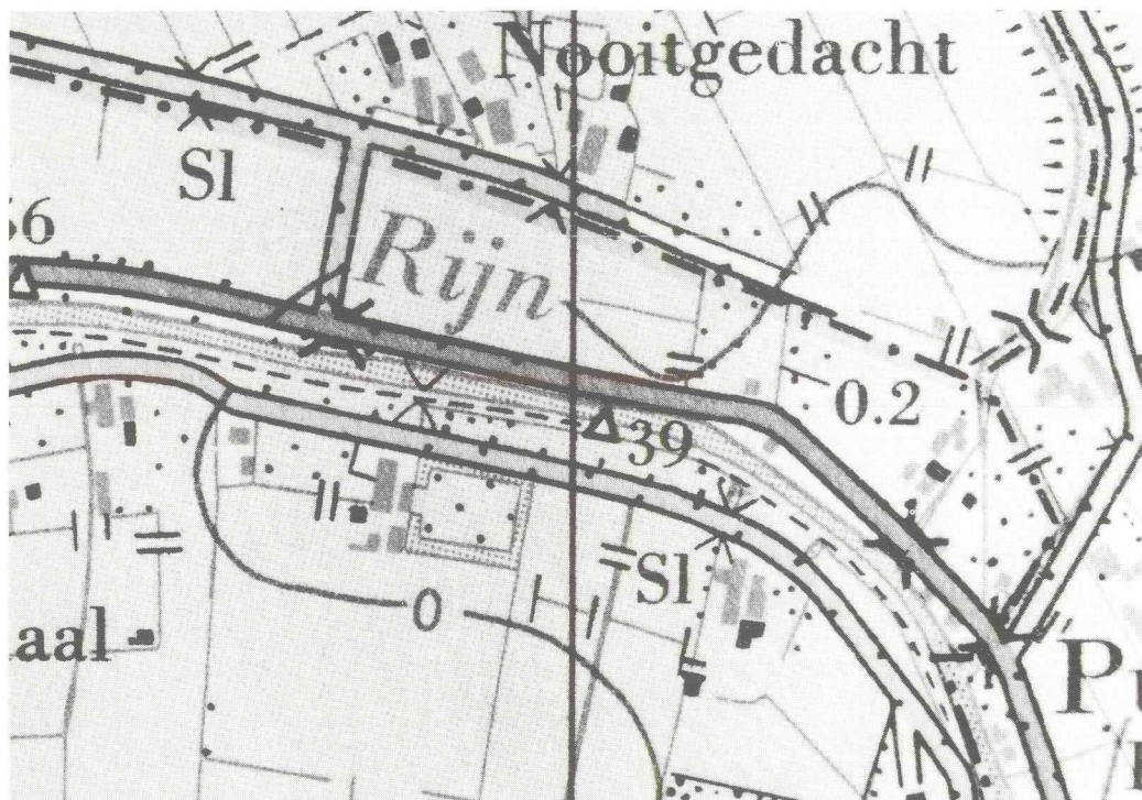
Afb. 2. Gedeeltelijke uitvergroting van afb. 1.

Dit laatste perceel ligt binnen een sloot, waarvan de grootste breedte oploopt tot ongeveer 10 meter. Dit is een ongehoord en opvallend fenomeen (zie afd. 2), wat te kenschetsen is als een opzet van landsheerlijke kasteelbouw van allure in de 13e eeuw.