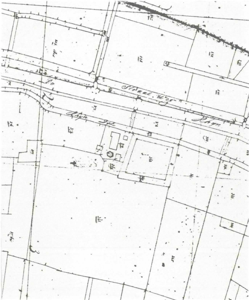
Afb. 3. Gedeelte van de kadasterkaart uit 1832.

En dat deze aanblik niet van vandaag of gisteren is, is af te leiden uit de situering van het complex op een kadasterkaart uit 1832 (zie afb. 3). Het burchtterrein en de kasteelplaats zijn in nagenoeg dezelfde situatie op deze kaart te onderscheiden met een aan het kasteelperceel grenzende boerderij.