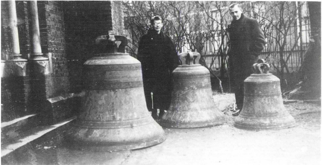
De drie torenklokken van de R.K.-kerk werden voor het oog van geestelijkheid en parochiebestuur in januari 1943 weggehaald.

In het archief vinden we dan verder niets meer over de klokken tot 9 juli 1940. Dan krijgt het Rooms-Katholiek Parochiaal Kerkbestuur een brief van de burgemeester van Oudewater, dat de kerkklokken tot nader aankondiging niet mogen worden gebruikt op grond van een aanschrijving van de Inspecteur voor de bescherming van de bevolking tegen luchtaanvallen. Op 30 april 1941 wordt bericht dat een beperkt gebruik van de luiddklokken weer is toegestaan, omdat Oudewater toen over een sirene beschikte om de bevolking in geval van bominslag te alarmeren.