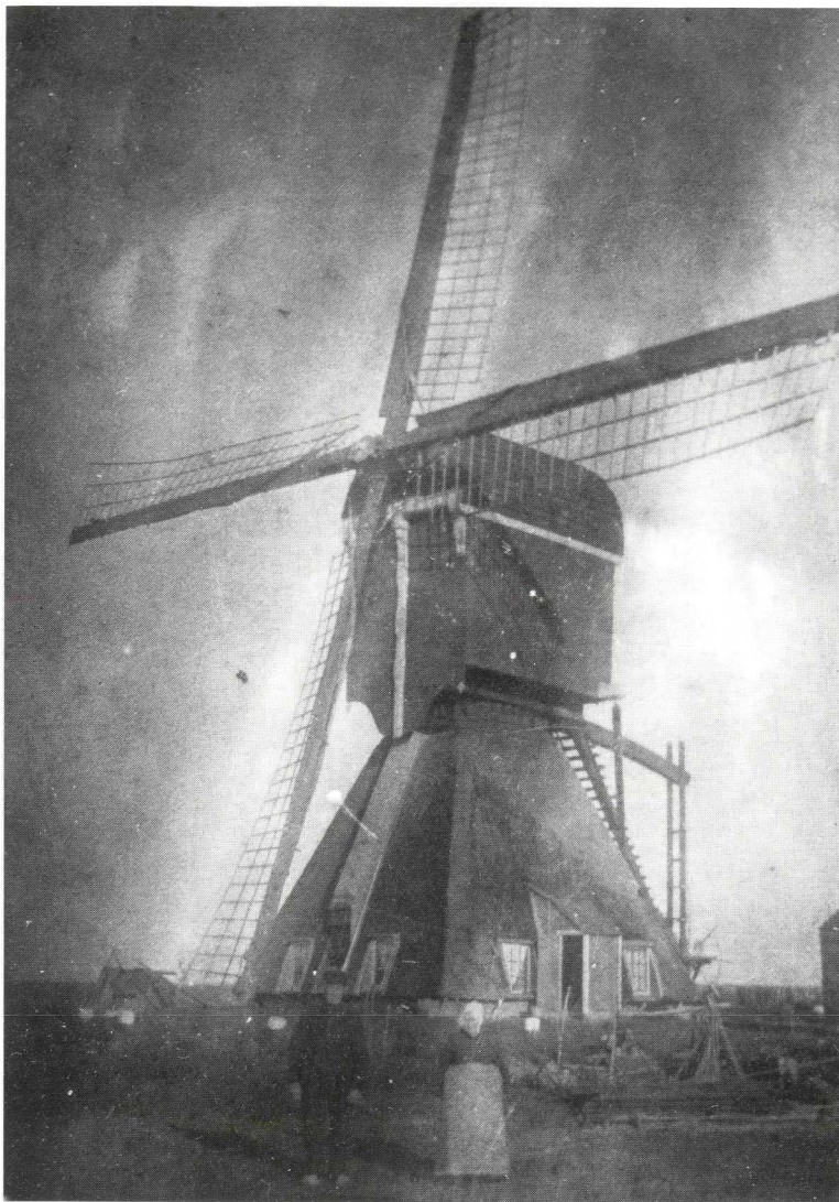
Een unieke, helaas kwalitatief wat mindere foto van de Groot-Houtdijker molen met op de voorgrond de laatste molenaar A.Spek met zijn vrouw.