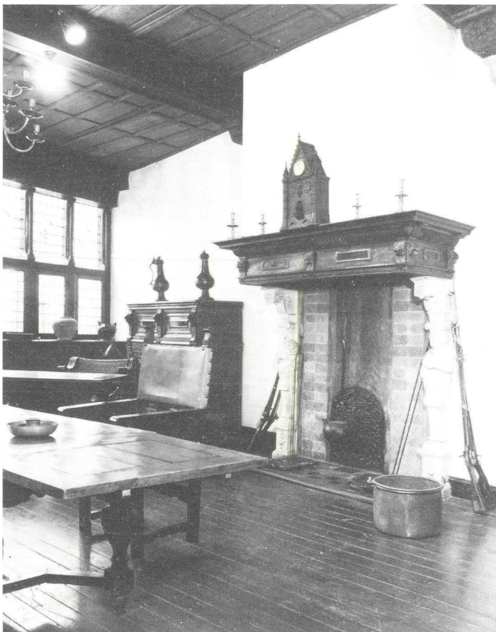
Vroedschapszaal in het stadsmuseum vóór de restauratie.