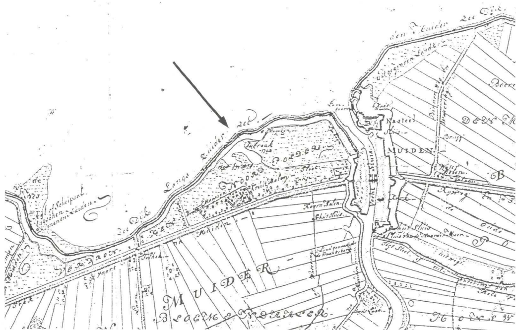
Plaats van de doorbraak bij Muiden van 1702. Fragment van een geniekaart van Ketelaar, nagetekend 1805.

Over een lengte van 73 meter werd de dijk weggeslagen 5 en weldra nam het brakke water bezit van de eerste polders in Holland en Utrecht.