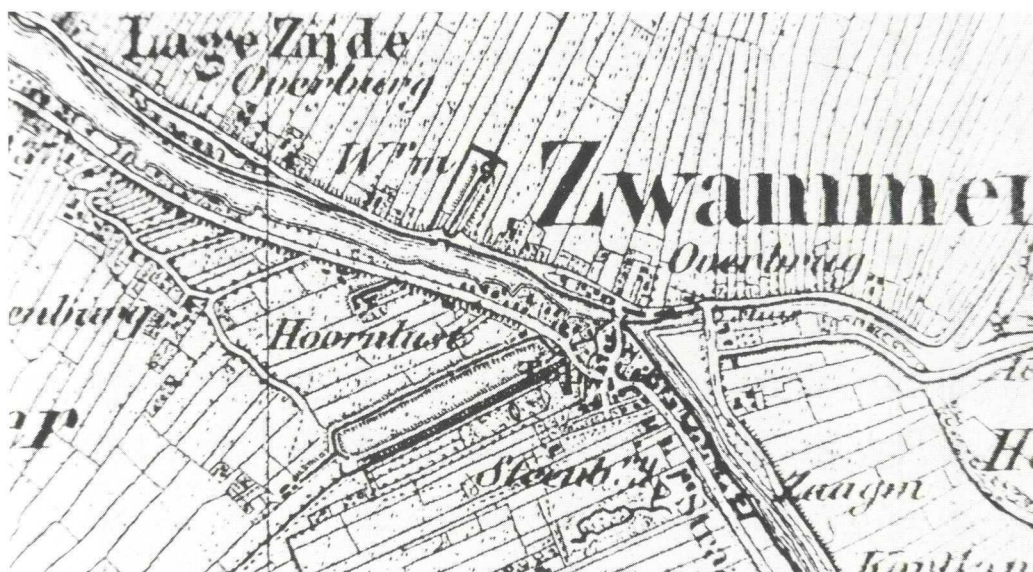
Fragment van de militaire topografische kaart uit 1850, waarop het castellumterrein (onder de naam Hoornlust), in 1301 aangeduid als „de borch” en bestaand uit 9 akkers, goed is af te lezen.

Hoewel een latere naamscontinuering helaas ontbreekt, wordt deze constructie gedragen door zowel de archeologische gegevens met de toponymie, als door de aanduiding in de visserij-rechten en de daarop volgende continuïteit in de vaststelling van de graafschapsgrens.