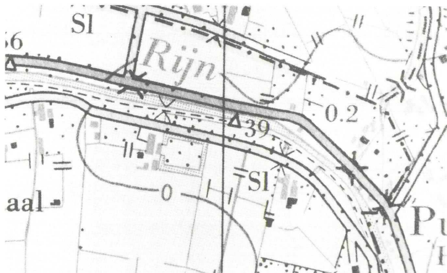
Détail-uitvergroting van de topografische kaart (31 G), van een gedeelte van Breeveld ten oosten van Woerden, met het imposante en opvallende boomgaardcomplex; rechts de aanzet van de plaatsaanduiding Putkop.

Door politieke manipulaties in de 13e eeuw ten tijde van en tussen graaf Floris V en bisschop Jan van Nassau en diens dienstmannen Herman van Woerden en Gijsbrecht van Amstel, komt de graafschaps grens via Bodegraven en Woerden, rond 1281, tenslotte in 1299 nabij de Putkop te Harmelen te liggen.