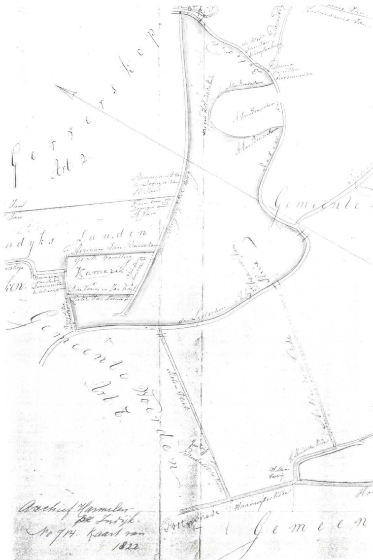
Fragment van de kaart behorende bij het proces-verbaal van grensbepaling van de gemeente Harmelen na de vereniging met de gemeente Indijk, 1822. (Gemeente-archief Harmelen inventarisnummer 714).

Hair", eigenaresse van de weg. Het was haar eis geweest, de Tiendweg zo veel mogelijk te volgen, waarbij dit gedeelte van de kade haar eigendom zou blijven.