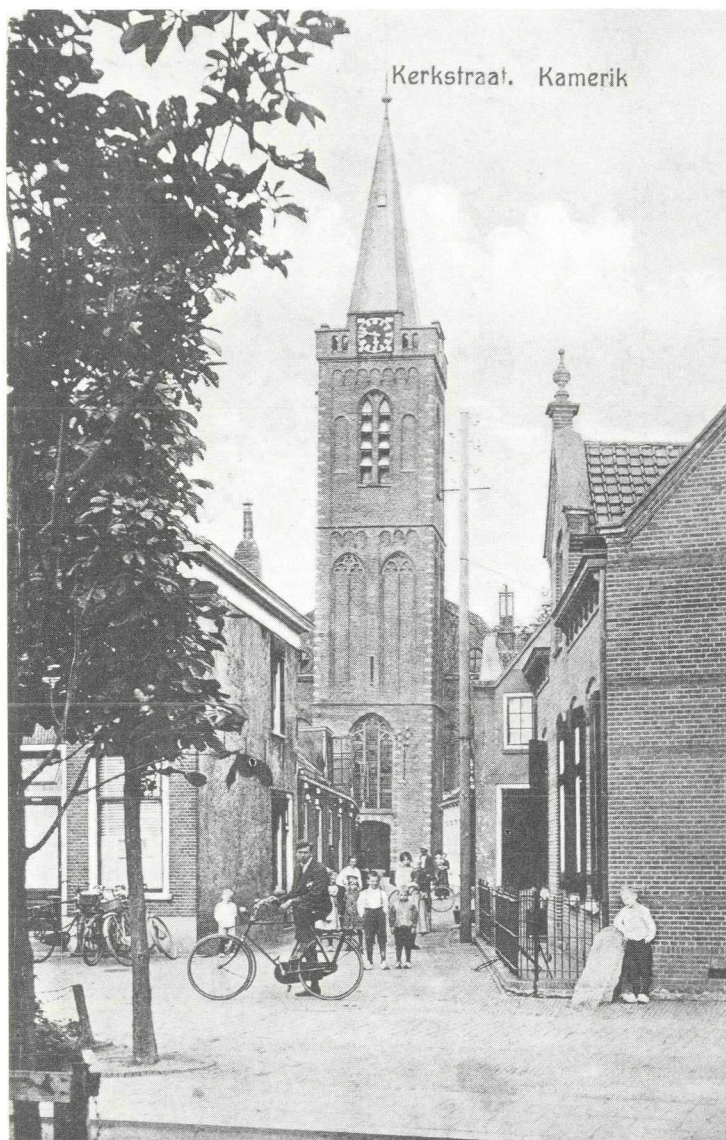
Kerkstraat met gezicht op de Nederlands-Hervormde kerk.

Nog iets verder heeft U via de Kerkstraat een prachtig doorkijkje naar de Nederlands-Hervormde kerk.