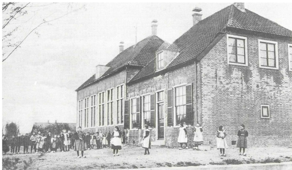
... aan de overzijde de Rooms-Katholieke school, ca. 1915.

Er zijn hier geen wettelijk beschermde monumenten, maar wat een prachtige boerderijen staan hier! Let eens op de overzijde, boerderij Vredebest (op het inrijhek) met z'n twee leilinden (geleide linden) voor de voorgevel om schaduw en koelte te krijgen en de authentieke boerenvoortuin.