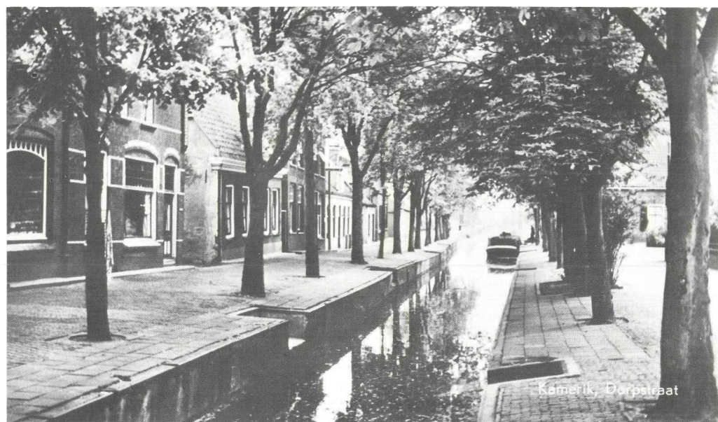
Zo was het in 1950.