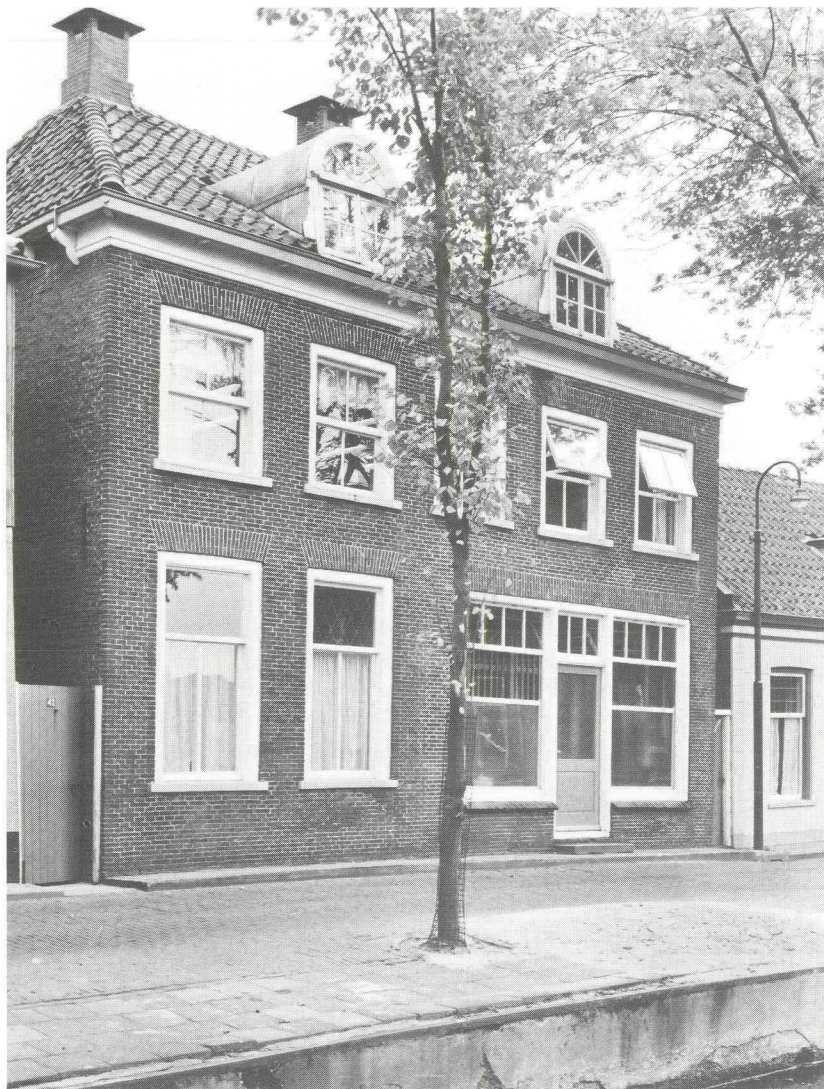
Van Teylingenweg 41, ca. 1966.

Numer 41 is wel wat achteruit gegaan vergeleken met de foto uit 1966.