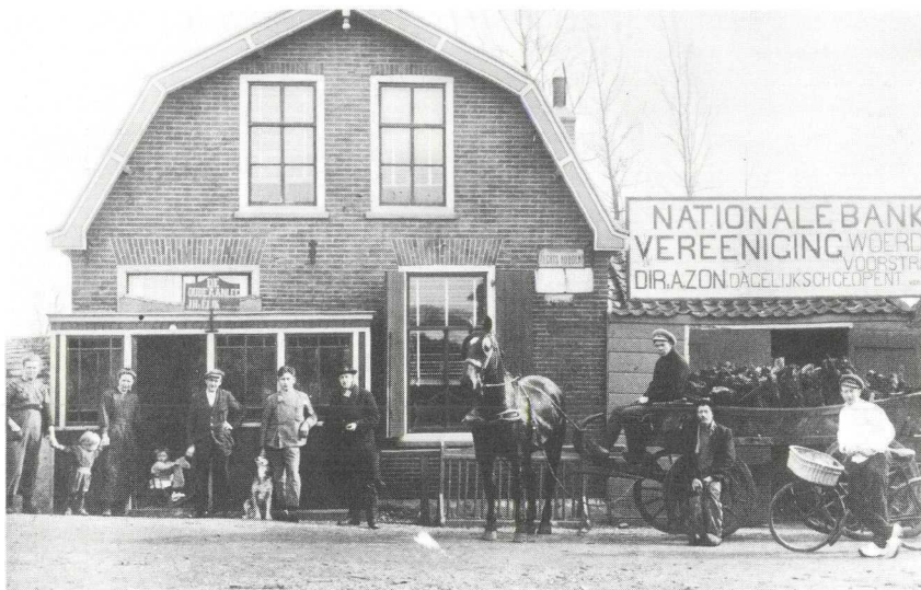
Bij de Oudendam, ca. 1925.

Als U uitgerust bent fietst U door en steekt U de gevaarlijke Ir. Enschedeweg over richting Kockengen. Nu fietst U de buurtschap Teckop in.