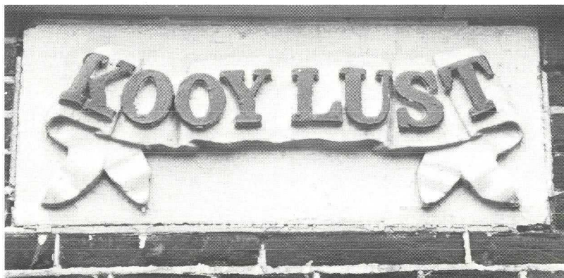
Gevelsteen boerderij „KOOYLUST” - Willeskop A65

Een ongeveer gelijke situatie treffen we aan bij boerderij „KOOYLUST” - Willeskop A65. Daar treffen we naast de naam-gevelsteen nog een kleine steen rechts onder in de gevel aan met het opschrift: VERN = 1840 C.D.B. Hier hebben we te maken met een oude steen in een nieuwere gevel.