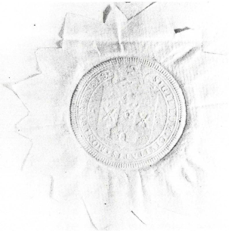
2. Het midden-18e eeuwse stadszegel (vergroot).

Een ander gebruik van het Montfoortse zegelstempel is bekend uit de achttiende eeuw. In het Gemeentearchief van Woerden is een reeks akten van indemniteit (= schadeloosstelling) voorhanden, waarvan er verscheidene zijn afgegeven door het stadsbestuur van Montfoort. In deze akten verklaarde de stad zich bereid Montfoortenaars die naar Woerden verhuisden te onderhouden indien zij tot armoede zouden vervallen. Van de Woerdense verzameling zijn zestien akten afgegeven door het stadsbestuur van Montfoort. Op drie onbezegelde akten na zijn zij voorzien van het opgedrukt zegel van de stad. Uit de jaren 1727 tot 1741 zijn dat afdrucken van het oude stempel, dat toen al ongeveer vier eeuwen in gebruik was. Het werd als vanouds afgedrukt in was, maar omdat een zegelafdruk in was op papier geplakt veel sneller verbrokkelt dan een uithangend zegel, legde men een stukje papier over de was en maakte daarin de afdruk. Als het zegel verbrokkelde werd het nog bijeengehouden door het papier erover. Later, door de zeevaart op Indië, kwam de zegellak in gebruik en ging men dat materiaal gebruiken voor opgedrukte zegels.