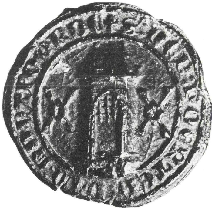
1. Het 14e eeuwse stadszegel (vergroot).

houten klossen vastgespied. Wanneer de molenspil in draaiende beweging wordt gebracht, draait dus de looper mee en wordt het koren fijngemalen tussen de beide molenstenen, de looper en de ligger 3 .