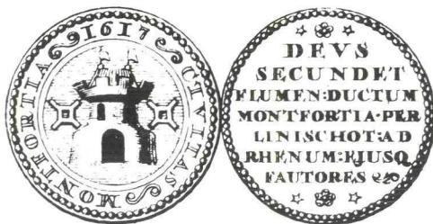
4. Montfoortse gedenkpenning, 1617.

opgenomen bij de rede van Dr. C. Dekker (Afb. 2 en 3 aldaar). Op de gravure van ca. 1620 is in het wapen een stadspoort te zien die sterke overeenkomst vertoont met de poort in het oude stadszegel. De gravure van ca. 1660 laat, evenals de gedenkpenning uit 1617 en de beide achttiende eeuwse stadszegels, een ronde toren zien. De toren heeft een schilddak waarop twee vaantjes staan. Achttiende eeuwse schrijvers noemen steeds de toren een burg.