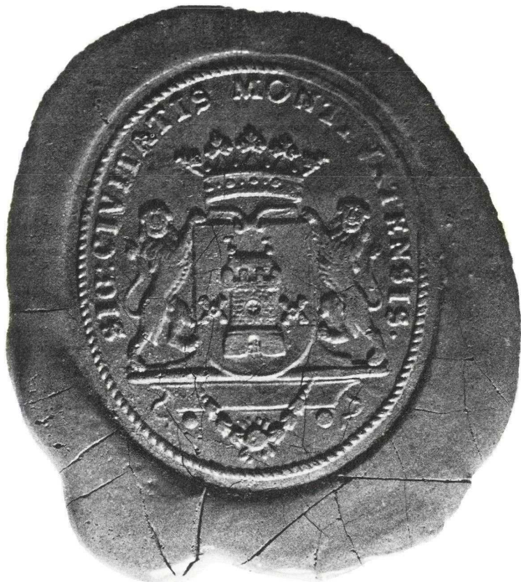
3. Het laat-18e eeuwse stadszegel (vergroot).

Op twee akten uit 1800 en 1802 zijn afdrucken van weer een nieuw stempel te zien (Afb. 3). Dit stempel werd rechtstreeks in de lak afgedrukt. Het zegel is ovaal, met een breedte van 2,8 cm. en een lengte van 3,4 cm. Het stadswapen wordt in dit zegel gedekt door een vijfbladige kroon en twee leeuwen fungeren als schildhouders. Het randschrift luidt hier SIGILLUM CIVITATIS MONTFVRTENSIS 6 .