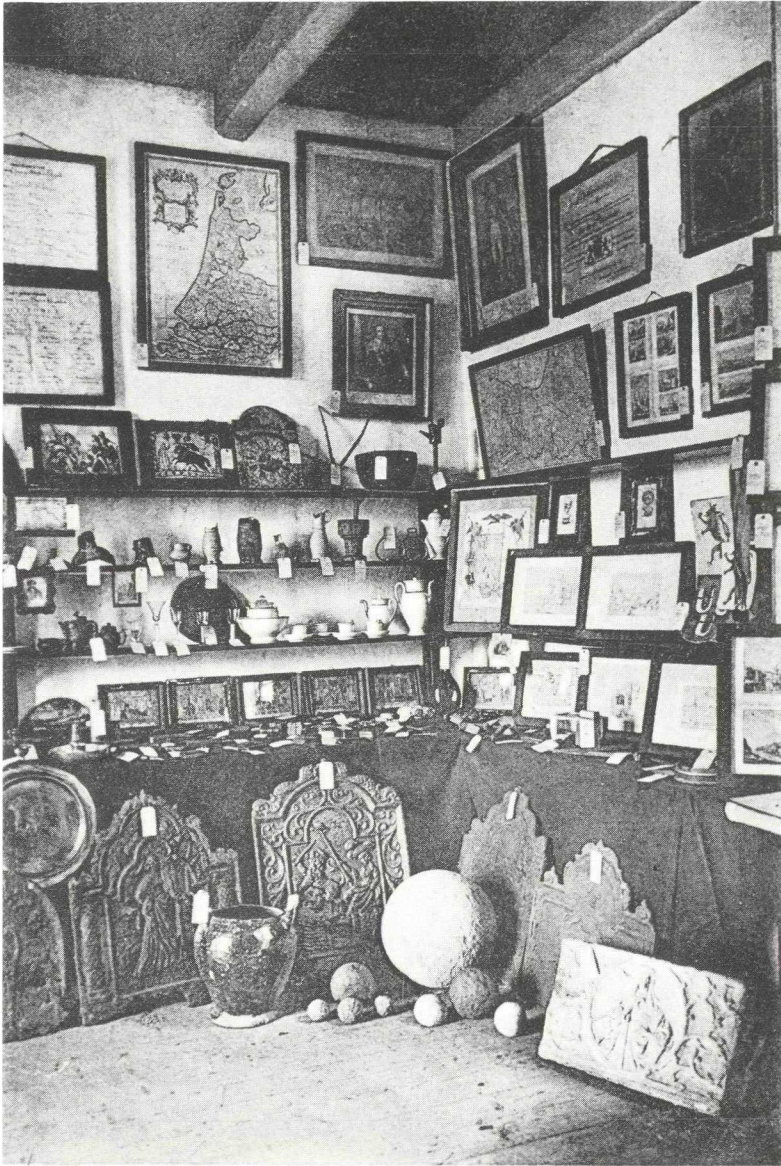
60 Hoekje in het Museum van Oudheden-Montfoort