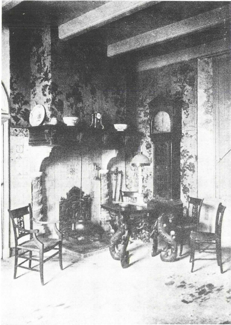
Museum te Montfoort.