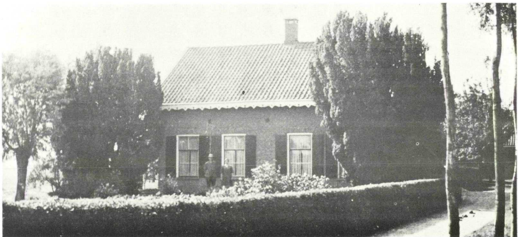
Foto Hofstede Veldzicht, ca. 1950

De kleine voormalige tolgaarderswoning (no. 14) staat eveneens aan de linkerzijde. Rechts van het huisje is de Berghoef-Bank die is geplaatst ter herinnering aan Steven Berghoef (1868-1963) die een bekend ingezetene van Linschoten was en gedurende ca. 70 jaren verbonden is geweest aan de gemeente-secretarie van Linschoten en Snelrewaard.