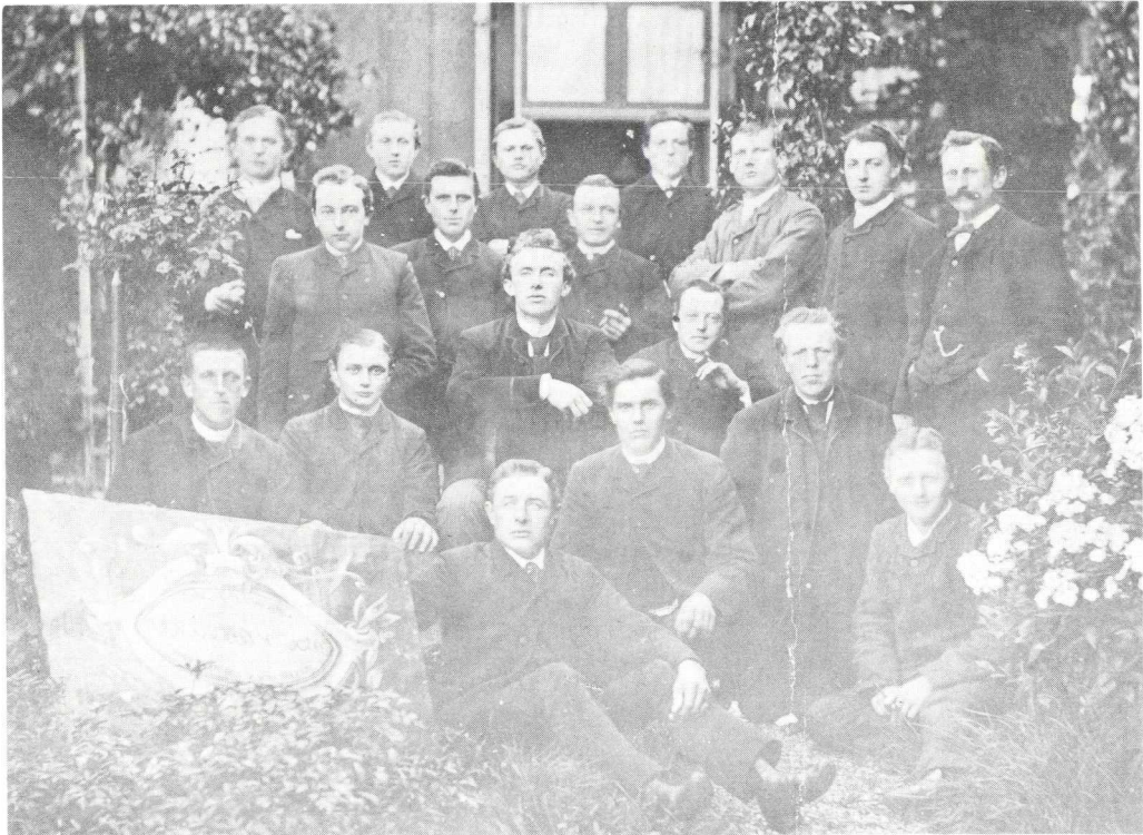
Leden der zangvereniging "Vriendschap" op 11 augustus 1889.

Een aantal afbeeldingen uit dit schetsboek - dat het opschrift draagt "Schetsen uit het Kinderleven" - worden in dit nummer gereproduceerd.