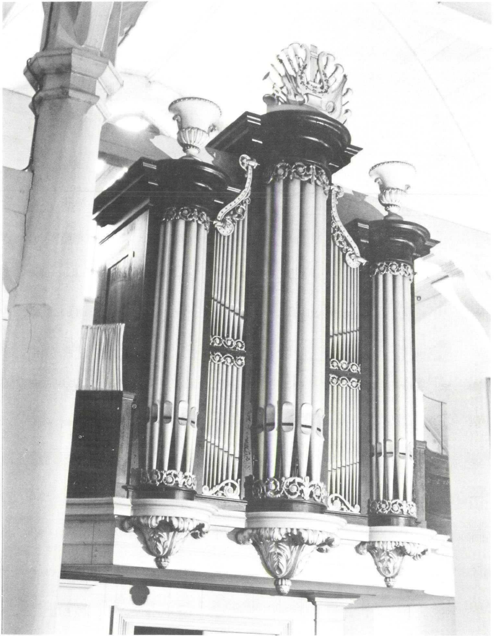
Orgel Evangelisch Lutherse kerk Woerden.