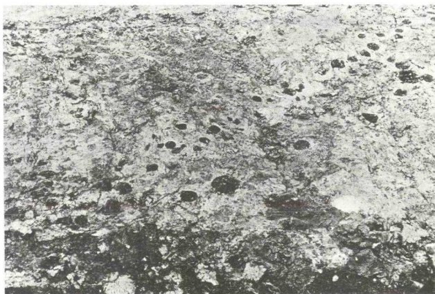
Palen van een oeverversterking langs de Linschoten (? ) in het onderste opgravingsvlak onder de schietkelder van de politiekazerne te Woerden.

Het terrein van de schietkelder (c. 12 x 30 m) bevindt zich aan de rand van de hoogte waarop de kern van Woerden is gebouwd. Het huidige oppervlak ligt hier op c. 1,60 m + N.A.P. en stijgt langzaam tot ongeveer 2,40 m + N.A.P. in de omgeving van de Hooge Woerd en de Hervormde kerk. De in 1952 onder de kerk aangetroffen brandlaag deed vermoeden dat dit ge-