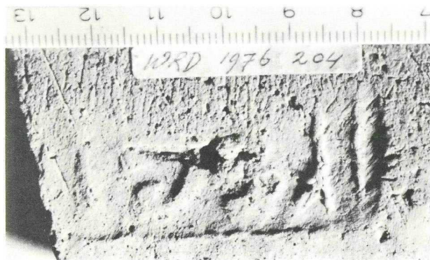
afb. 4 - Grafitti-fragmenten op terra sigillata en gladwandig aardewerk (tek. Pc,B.).