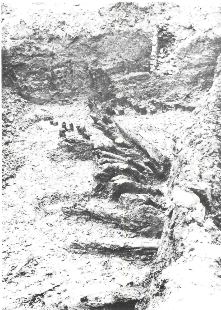
Woerden 1978. Omgevallen palen van oeverversterkingen langs de zuidzijde van de Romeinse bedding van de Rijn op het terrein van het voormalige St.-Jozefpensionaat.