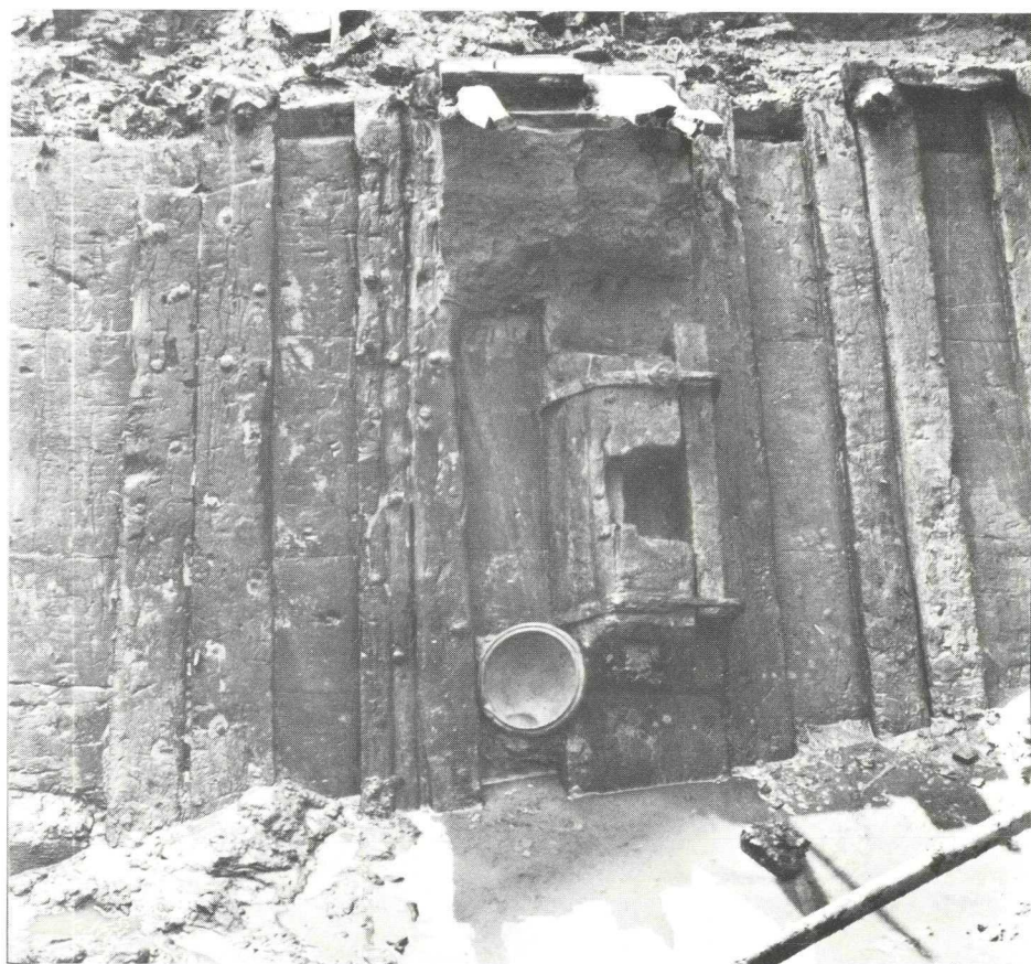
Woerden 1978. Mastblok met sluitbalk van het schip.

In de bovenste hiervan bleken spijkers te zijn geslagen; dit wijst er waarschijnlijk op dat daarop nog een houten rand heeft gelegen. Aan de binnenzijde van het boord was op halve hoogte een plank (bewegering) tegen de spanten bevestigd. Op verscheidene plaatsen is geconstateerd dat daarvoor een bekleding is aangebracht van dun hout of wagenschot. Ook de mastvoet is nog aangetroffen. Deze bestond uit een extra brede spant met in het midden een rechthoekig blok, en was geheel uit één stuk hout gekapt. In het blok bevond zich een rechthoekig gat voor de mast, dat aan de achterzijde afgesloten kon worden door een balk, die door ijzeren beugels op zijn plaats werd gehouden. Onder en achter de mastbank was zorg gedragen voor een onderkomen voor de bemanning. Daar was een vierkante haard gemaakt en aan de voorzijde van de mastbank was een kastje getimmerd. Het ziet er naar uit dat men het geheel heeft kunnen overdekken; op 1.25 m achter de mastbank waren tegen de binnenzijde van de boorden twee blokken met zwaluwstaartvormige uitkepingen aangebracht, waarin kennelijk dwars over het schip een balk kon worden gelegd.