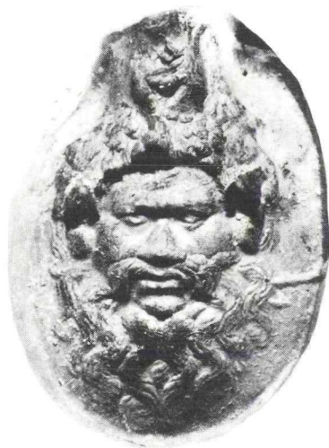
Woerden 1978. Negatieve vorm voor het versieren van het oor van een kan, met de afbeelding van de kop van een Silenus.