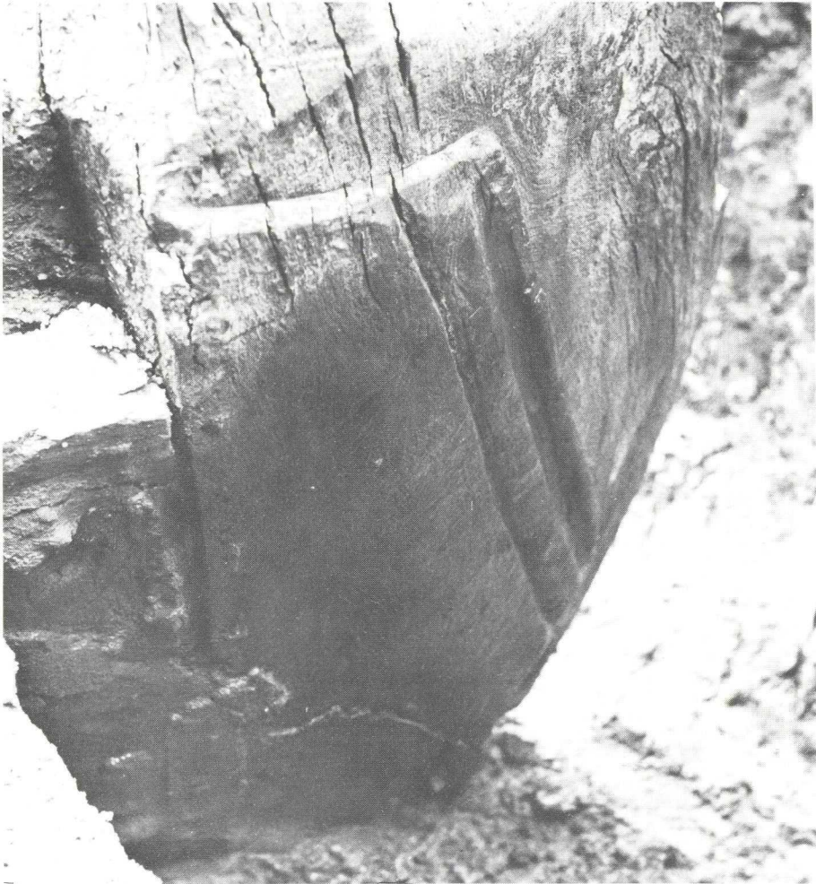
Woerden 1978. Onderzijde van de voorsteven van het schip.

Van de boot kon een stuk ter lengte van bijna 10 m worden opgegraven, voldoende om een en ander in verband te kunnen brengen met de grote schepen uit Zwammerdam (zie M.D. de Weerd, Römerzeitliche Transportschiffe und Einbäume aus Nigrum Pullum / Zwammerdam (Z.-H.), in: Studien zu den Militärgrenzen Roms II, Köln-Bonn 1977, 187-198).