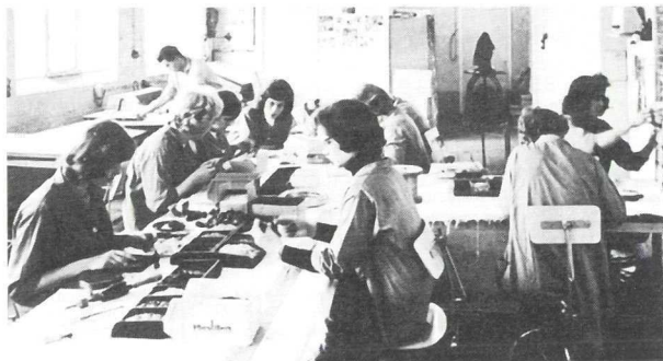
Interieur fabriek Hopmi in Woudenberg

Eind 1960 fuseerde de Hopmi met Inventum uit Bilthoven dat een aantal malen groter was,