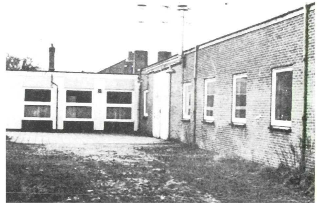
Fabriek Hopmi in Woudenberg