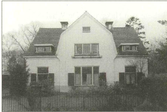
De Blauwe Schorteldoek op een foto van 1977

Zeister Kroost een stuk grond gehuurd of gekocht dat tot de Biltse Blauwe Schorteldoek behoorde of andersom. Wie wil verkennen, zal na het genoemde huisnummer 17 van de Blauwe Schorteldoek ook de nummers 15 en 13 dienen te passeren en zelfs de Kroostweg-Noord moeten inslaan, want volgens een adresboek van De Bilt en Bilthoven uit 1971 en een latere uitgave woonden daar op de Kroostweg-Noord 177 ook een of meer Biltaren. Dat is nu ook nog zo.