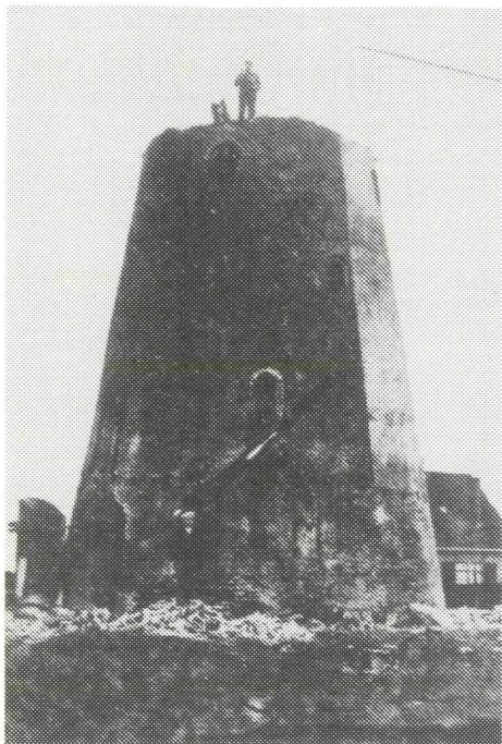
Sloop van molen „De Windhond,,