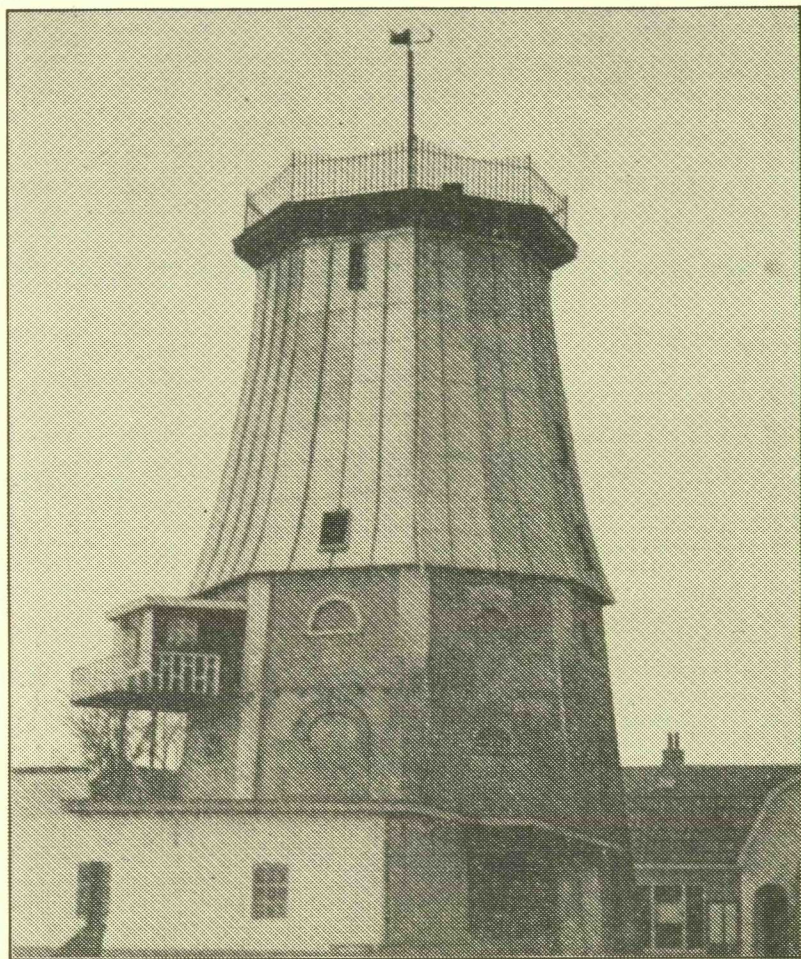
De ontakelde molen „De Vlijt„ (uit Pensioengids 1937 V.V.V. Soest Vooruit)