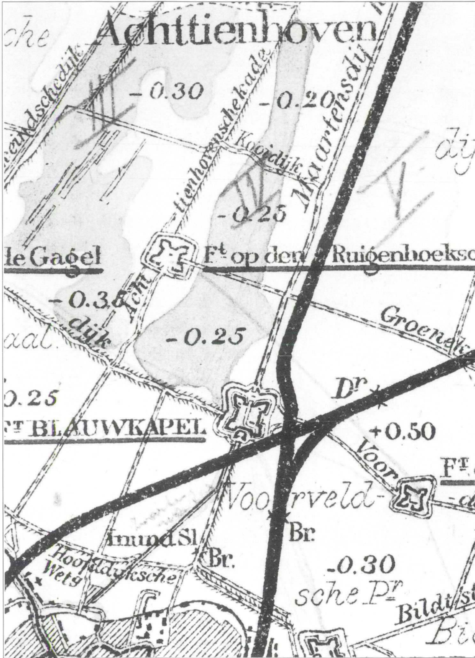
R.A.U., archief Genie Utrecht. Inundatiekaart van de Nieuwe Hollandse Waterlinie (detail). Topografische Dienst, 1903. Lithografie, gedeeltelijk ingekleurd, afm. detail: 6x4 cm.

Het huidige knooppunt van wegen en spoorlijnen rond fort Blauwkapel verradt nog steeds de strategische ligging van dit in 1817-1818 aangelegde verdedigingswerk. Het fort was een onderdeel van de Nieuwe Hollandse Waterlinie, die in de periode 1815-1940 het westen van ons land en daar-