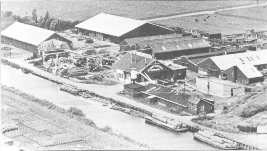
Luchtfoto van de houthandel en -zagerij Hulsman aan de Angstelkade te Nieuwersluis. Foto na 1945. Coll.: W. Mooij.

werd een doodskist gemaakt. Mensen die mij daarmee hadden zien lopen, wisten dus al wat er aan de hand was.