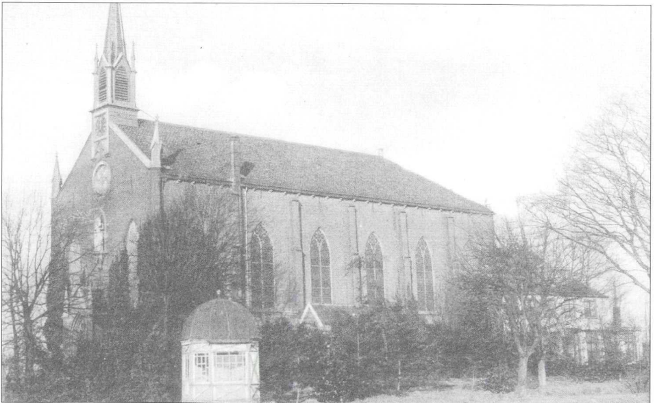
De rooms-katholieke kerk in Loenersloot, omstreeks 1930.

Een enkele keer kwam de kerk ter sprake.