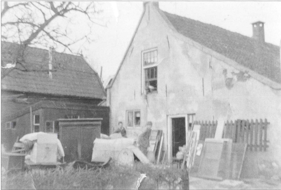
Het huis Binnenweg 36 tijdens de verhuizing van het gezin in 1939.

Vader was enig kind en van beroep boerendaggelder. Hij werkte in zijn jonge jaren met anderen in de polder, waar zij de nachten vaak moesten doorbrengen in een hooiberg, soms wel een hele week. In die tijd leerde hij mijn moeder kennen. Haar ouders hadden in Eemnes een boerderij met ongeveer 3000 kippen. Moeder was een optimistische vrouw, sterk van geest en gevoelig. Omdat ze van-huis-uit veel verstand van kippen had, hield zij ze ook graag. Bij ons thuis aan de Binnenweg liepen er dan ook altijd 10-12 kippen in de groentetuin. Ik zie haar nog altijd eieren rapen en die opbergen in haar schort. Onze kippen gingen ook wel eens buurten bij de kippen van buurman Kruiswijk. Zo nu en dan moest ik ze terughalen, maar welke kippen waren van ons?. Moeder zei: ach jongen dat doe je zo, ze nam een schaalje met voer erin en riep: "kiep, kiep, kiep", en daar kwamen ze aangerend. Daar sta je als kind toch van te kijken. Overigens gebruik ik die methode nu nog steeds. Vader hield niet van kippen, hij lustte zelfs geen eieren. Bij het lezen van het scheppingsverhaal vertelde hij het volgende: "bij het scheppen van de kippen, voer Gods' wijsheid op de klippen".