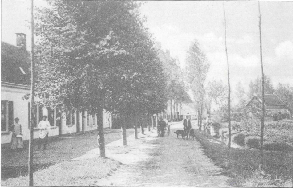
De Binnenweg in Loenersloot omstreeks 1920.

moest ik zeven jaar op de lagere school in Loenersloot doorbrengen, voordat ik naar het voortgezet onderwijs kon doorstromen. Ik herinner me nog dat ik op de schoenen van mijn broers naar school moest lopen. Thuis liep ik altijd op blote voeten of op klompen. De schoenen van mijn broers pasten niet zo goed, dus nam ik de schoenen in mijn handen en liep verder dan op blote voeten.